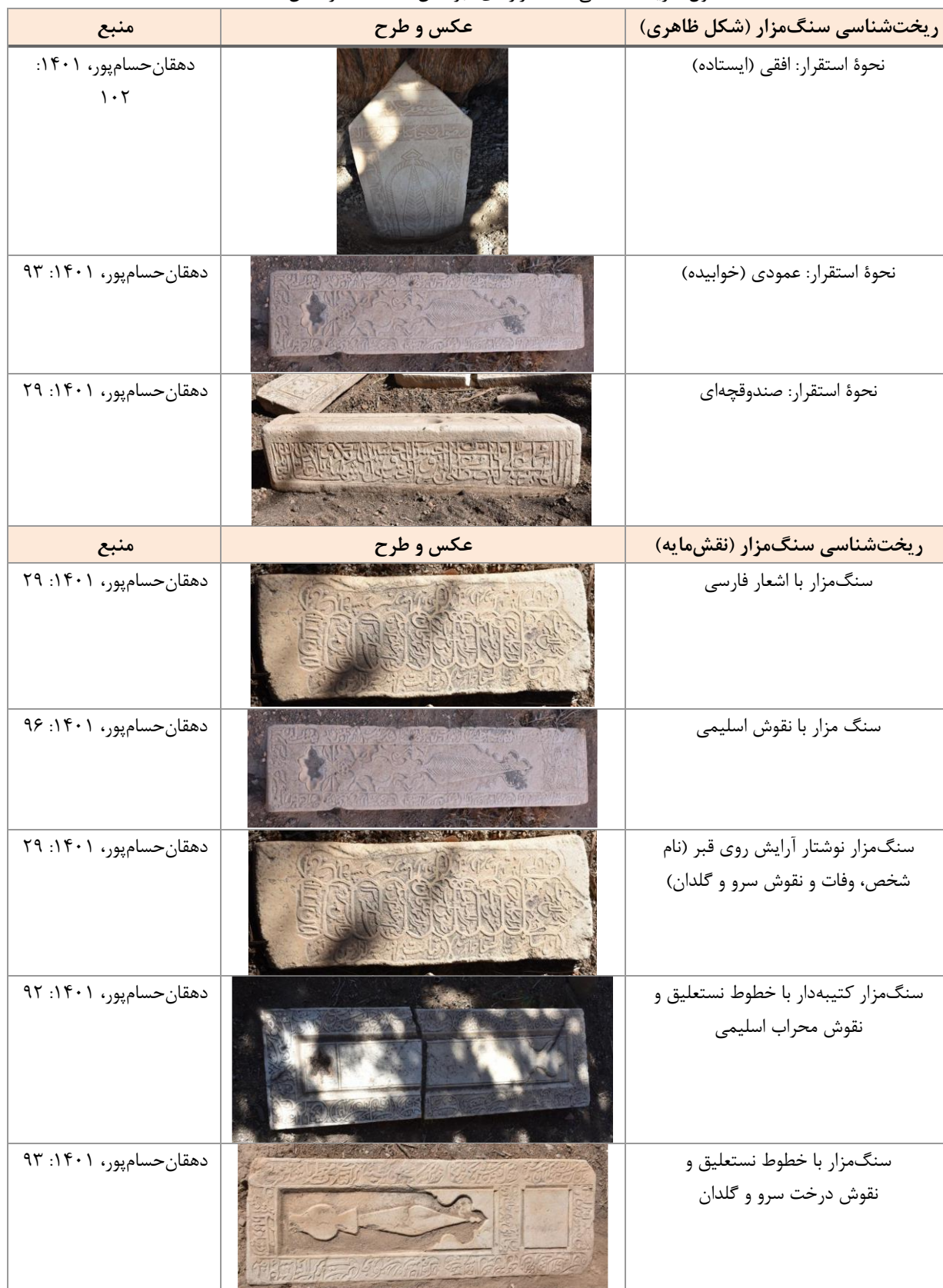
جدول ۳. ریخت‌شناسی سنگ‌مزارهای قبرستان قدمگاه (نگارندگان، ۱۴۰۴)