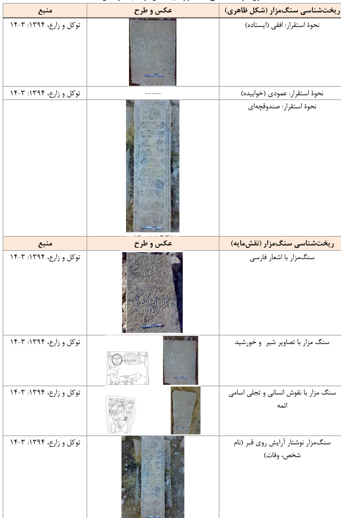
جدول ۲. ریخت‌شناسی سنگ‌مزارهای سلطان ابراهیم (نگارندگان، ۱۴۰۴)