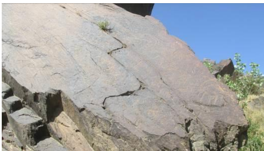
شکل ۵: گروه دیگری از سنگ‌نگاره‌های سیمین با نقوش انسانی، حیوانی (بزسانان و سگ‌سانان)