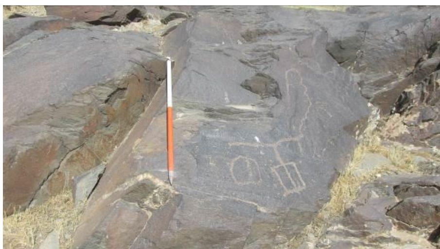
شکل ۴: نگاره‌های نمادین و نامشخص از سنگ‌نگاره‌های سیمین (نگارنده)