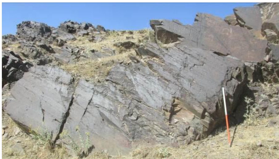
شکل ۲: نمایی کلی از سنگ‌نگاره‌های سیمین

خطی از وسط آن را به دو بخش تقسیم نموده است. با توجه به اینکه هیچ نوع نگاره دیگری در مجاورت این نگاره وجود ندارد نمی‌توان این نگاره را تفسیر نمود (شکل ۴).