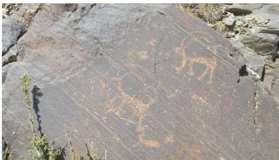
شکل ۳: نگاره بزسانان با شاخ‌های اغراق آمیز (نگارنده)