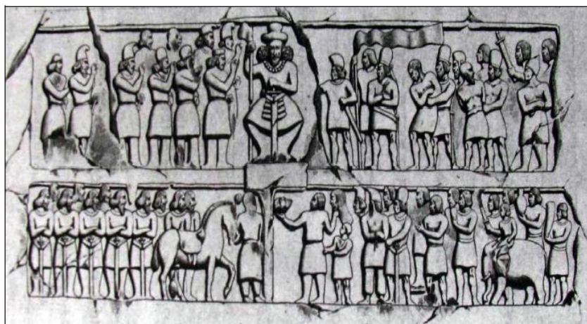
شکل ۲: نقش‌برجسته منتسب به پیروزی بهرام دوم بر شاه سکستان (موسوی‌حاجی و سرفراز، ۱۳۹۷: ۲۳۳، شکل ۳۸)