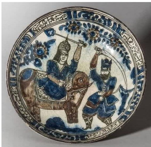
شکل ۱۷: نبرد مرد فیل‌سوار و گرز به دست با رزمجویی پیاده با شمشیر (موزه هنرهای شرقی روسیه)

روندی که در روزگار ساسانی مورد توجه طبقه نخبه و بخصوص دربار شاهنشاهی ساسانی قرار گرفت، در دوران اسلامی نیز هم‌چنان مورد اقبال بوده است. در دوران اسلامی استفاده از فیل در نبردها مایه فخر شاهان مسلمان و سلسله‌های ایرانی و ترک‌زبان به شمار می‌رفت. مؤلف سلجوق‌نامه در توصیف وضعیت افول غزنویان و طلوع سلجوقیان، بهره‌گیری از فیل در هنگام نبرد را به‌خوبی توصیف کرده است (ظهیرالدین نیشابوری، ۱۴۰۰: ۱۰-۱۱). بنظر می‌رسد این نوع بهره‌گیری از فیل در سده‌های نخستین و میانه اسلامی تداوم شیوه‌های روزگار ساسانی بوده است. نکته آنکه تصویر یک بشقاب سفالی از دوره قاجار مشابه توصیفی است که سلجوق‌نامه در مورد توصیف نبرد سلطان مسعود غزنوی با نیروهای سلجوقی ارائه کرده است (شکل ۱۷). اگرچه در این صحنه نسبت‌ها به درستی رعایت نشده است؛ اما به خوبی تسلط راکب فیل بر جنگجویی پیاده آشکار است.