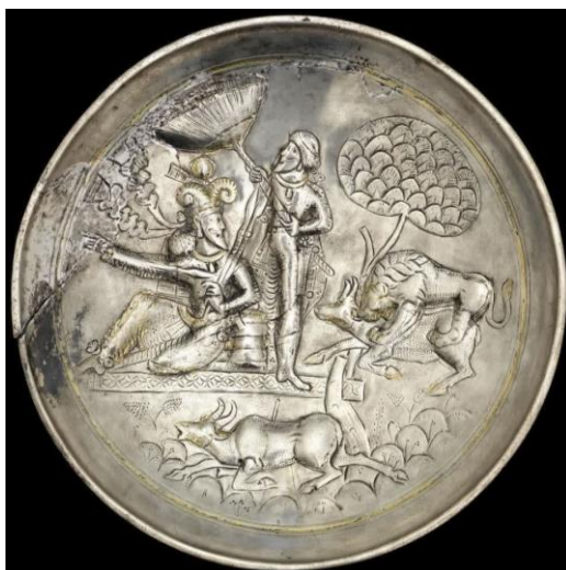
شکل ۱۶: شاهنشاه ساسانی در حال تماشای صحنه شکار (https://www.bonhams.com/auction/22837/lot/74/a-). (sasanian-silver-gilt-royal-plate/)

روندی که در روزگار ساسانی مورد توجه طبقه نخبه و بخصوص دربار شاهنشاهی ساسانی قرار گرفت، در دوران اسلامی نیز هم‌چنان مورد اقبال بوده است. در دوران اسلامی استفاده از فیل در نبردها مایه فخر شاهان مسلمان و سلسله‌های ایرانی و ترک‌زبان به شمار می‌رفت. مؤلف سلجوق‌نامه در توصیف وضعیت افول غزنویان و طلوع سلجوقیان، بهره‌گیری از فیل در هنگام نبرد را به‌خوبی توصیف کرده است (ظهیرالدین نیشابوری، ۱۴۰۰: ۱۰-۱۱). بنظر می‌رسد این نوع بهره‌گیری از فیل در سده‌های نخستین و میانه اسلامی تداوم شیوه‌های روزگار ساسانی بوده است. نکته آنکه تصویر یک بشقاب سفالی از دوره قاجار مشابه توصیفی است که سلجوق‌نامه در مورد توصیف نبرد سلطان مسعود غزنوی با نیروهای سلجوقی ارائه کرده است (شکل ۱۷). اگرچه در این صحنه نسبت‌ها به درستی رعایت نشده است؛ اما به خوبی تسلط راکب فیل بر جنگجویی پیاده آشکار است.