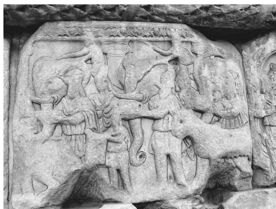
شکل ۱۳: بخشی از طاق نصرت گالریوس و حضور فیل‌ها به عنوان بخشی از یک نبرد تبلیغاتی (Canepa, 2009: Fig. 17)

نقشماپه‌ای تزئینی در نظر گرفته شود، باید آن را بخشی از منظومه فکری شاپور اول در زمینه فرّه ایزدی و همچنین بخشی از نبرد تبلیغاتی علیه روم به شمار آورد. چرا که رومیان خود به بهترین نحو از این شیوه نبرد برای اقناع افکار عمومی جامعه رومی بهره می‌بردند. تصاویر روی سکه‌ها که در بالا به آنها اشاره شد بخشی از این فرایند بوده است. در نقوش برجسته نیز مهم‌ترین نمود فیل‌ها به عنوان بخشی از نبرد تبلیغاتی روم بر علیه ساسانیان، در بخش پایین نقش برجسته نقر شده بر طاق نصرت گالریوس قابل ملاحظه است (شکل ۱۳). کانپا این موضوع را به خوبی مورد بررسی قرار داده است و حضور فیل‌ها را به عنوان بخشی از هدایای (Gifts) ایرانی‌ها به رومیان به منظور اقناع مخاطب رومی در نظر می‌گیرد تا آنها خود را پیروز میدان در تقابل با ساسانیان بدانند (Canepa, 2009: 97).