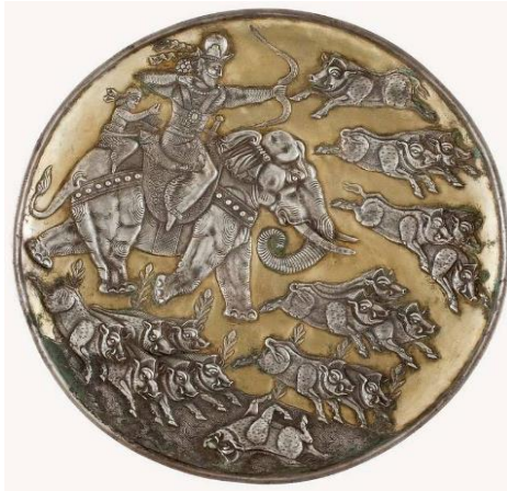
شکل ۵: شاه (شاپور دوم) و دستیار سوار بر فیل در حال شکار گراز (Los Angeles County Museum of Art inv. No. M.76.174.18).