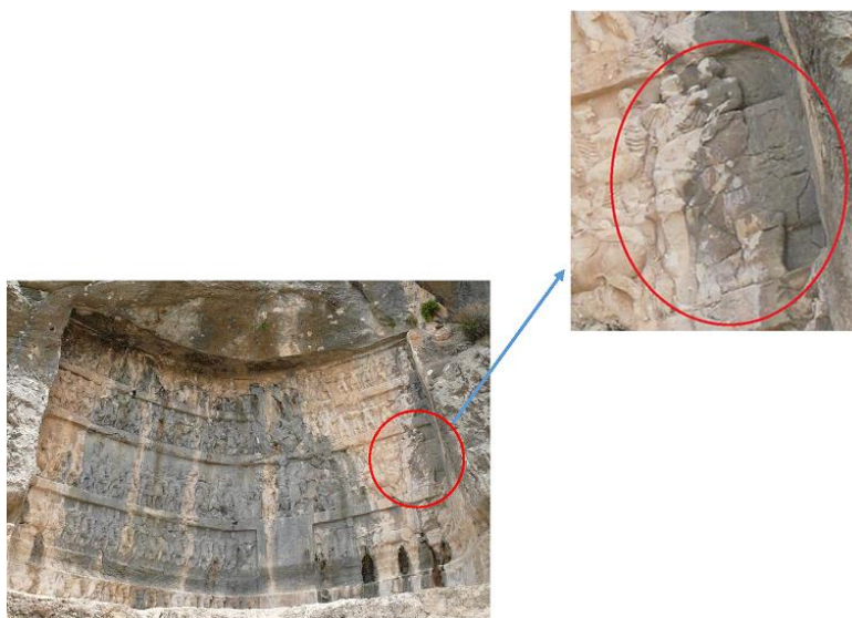
شکل ۱: فیل درشت‌هیکل در میان لژیون رومی در حضور شاپور اول، بیشاپور (نگارنده).

در یکی دیگر از نقش‌برجسته‌های ساسانی در بیشاپور که برخی از محققان آن را پیروزی بهرام دوم بر شاه سکستان دانسته‌اند (موسوی‌حاجی و سرفراز، ۱۳۹۷: ۲۳۳)، فیل‌بچه‌ای؟ به همراه دیگر غنائم/خراج به حضور پادشاه (بهرام دوم؟! ) بر تخت‌نشسته‌ای آورده می‌شود (شکل ۲). روشن نیست قامت کوتاه فیل به دلیل کم‌سن بودن این حیوان است یا عدم رعایت نسبت‌ها در کار شکل‌دادن حجاری؟ اما فردی که بر پشت این فیل نشسته است، نشان می‌دهد که فیل بالغی به حضور شاهنشاه آورده‌اند. شوربختانه نمی‌توان از این صحنه و از لابه‌لای متون تاریخی به بازسازی جزئیات وقایع تاریخی، مطالبی بیش از فحوای درج شده در نقش‌برجسته یاد شده برداشت کرد. بنابراین باید دانست هرگونه اظهارنظر مبتنی بر انتساب عنوان غنیمت جنگی و یا خراج سالیانه در مورد تصویر فیل حاضر در این صحنه بر خلاف تصویر صحنه‌ی پیشین در زمان شاپور، فعلاً منتفی است. لیکن حضور مجدد فیل بر دیواره سنگی و همچنین تصویر فرّه‌مند پادشاه ساسانی از پس دریافت غنیمت جنگی یا حتی خراج، حاکی از دقت در به نمایش درآوردن اندیشه‌ی فرّه‌مندی شاهنشاه ساسانی حاضر در تصویر است که فیل می‌تواند یکی از این نشانه‌ها در نظر گرفته شود. کما اینکه می‌توان چنین نظری در مورد حضور فیل رومی در صحنه نقش‌برجسته منتسب به شاپور را نیز مورد توجه قرار داد.