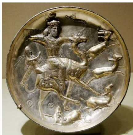
شکل ۶: بهرام گور و آزاده؟! سوار بر شتر در حال شکار (https://www.metmuseum.org/art/collection/search/327497).

در منطقه سغد، نقاشی‌های دیواری به‌عنوان یکی از مهم‌ترین عناصر تزئینی فضاهای معماری شناخته می‌شد؛ این نگاره‌ها اگرچه گاهی خارج از جغرافیای سیاسی شاهنشاهی ساسانی واقع بوده‌اند، اما شباهت‌های سبکی و محتوایی بسیار نزدیکی با سنگ‌نگاره‌ها و نقاشی‌های دیواری مناطق داخلی ایران را نشان می‌دهد. یکی از این نگاره‌ها که در ورخشا (بخارا) یافت شده است، صحنه شکاری را نمایش می‌دهد که یک شکارچی روی فیل بزرگ با زینی مجلل نشسته است (شکل ۷). در چند صحنه حیواناتی شبیه پلنگ به سوی فیل یورش آوردند (Mongait, 1959: 288-289). این صحنه مشابه تمامی صحنه‌های شکار منتسب به شاهان ساسانی روی بشقاب‌های نقره و طلاوندود این دوره است. علاوه بر این مشابه نقشمایه‌های مرتبط به شکار با فیل روی تابوت مرمری یوهونگ است که شرح آن در بالا ارائه شد. حضور حیوانات اسطوره‌ای چون اژدها از دو منظر قابل بررسی است. نخست آنکه این تصاویر شاه آرمانی به حوزه اسطوره‌ها ورود کرده است و دوم آنکه تأثیرات چینی منطقه سغد بر هنرهای تجسمی را به نمایش می‌گذارد.