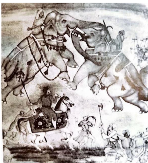
شکل ۱۵: مینیاتوری از دوره مغولی در هند؛ جهانگیر شاه در حال تماشای جنگ میان دو فیل (دیماندا، ۱۳۸۹: تصویر ۳۴).

علاوه بر بهره‌گیری از فیل‌ها در نبرد و شکار، هم‌چنین کاربردهای تشریفاتی در دربار ساسانی که پیش از این در متون تاریخی یونانی/رومی و هم‌چنین اسلامی به آنها پرداختیم، بنظر می‌رسد فیل‌بازی یا جنگ فیل‌ها نیز سرگرمی بود که در دربار از آن لذت می‌بردند. اگرچه منبعی از دوره ساسانی در دست نیست، مینیاتوری از دوره مغولی در هند، جهانگیر شاه مغولی هند را در حال تماشای جنگ میان دو فیل با فیل‌بانانی بر پشت آنها نشان می‌دهد (دیماندا، ۱۳۸۹: ۷۴). از تزئینات و منگوله‌های شرابه‌دار آویزان بر گردن و بدن فیل‌ها مشخص است چنین مراسمی صرفاً برای سرگرمی بوده است و هیچ جنبه تهاجمی یا تدافعی نداشته است (شکل ۱۵). چنین مراسمی قاعدتاً می‌بایست بیرون از فضای کاخ‌ها و در میدان یا حتی در پردیسی برگزار می‌گردید. صحنه شکاری از روزگار ساسانی روی بشقابی مستند شده است. این بشقاب امروزه در حراجی بنامز (Bonhams) عرضه شده و شاهنشاه ساسانی را در حال تماشای شکار به تصویر کشیده است (شکل ۱۶). در این بشقاب پادشاه ساسانی همان کاری را انجام داده است که قرن‌ها بعد شاه مغولی هند در قالب نقاشی دیواری انجام می‌دهد. فعل هردو یکسان، اما مصادیق حیوانی آنها متفاوت است. چه بسا که چنین صحنه‌هایی در دربار ساسانی بوده ولی به لحاظ تصویری یا اسنادی، مستندی از آن در اختیار نداریم.