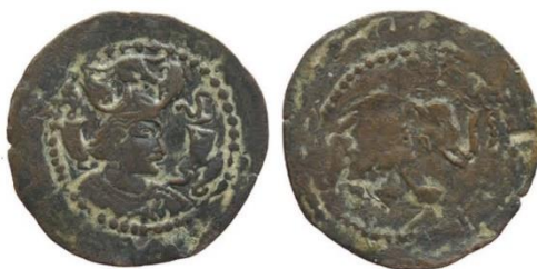
شکل ۸: سکه‌های نیزکیان در شرق ایران با تصویر فیل (Alram, 2018: 29, Fig. 21)

کارگیری جبهه تبلیغاتی نوینی است که به صورت ضمنی اشاره‌ای به غنیمتی بودن فیل‌های اسکندر و حتی فیل‌های بعدی شاهان هندی داشته است.