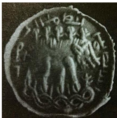
شکل ۱۲: اثر مهر، دوره ساسانی با نقش فیل هندی (کروگر، ۱۳۹۶: ص ۱۵: ۲).

علاوه بر موارد فوق، از تالار صلیبی شکل محوطه بیشاپور، دو قطعه گچبری با نقوش حیوانی به دست آمد که گیرشمن معتقد بود یکی از آنها سر یک فیل است که با رنگ‌های زرد، قرمز و سیاه رنگ‌آمیزی شده بود. قطعه دیگر نیز گردن یک اسب را نشان می‌داد (Ghirshman, 1983: 17). این نقشمایه‌ها به فراخور زمان ایجاد، بهره‌گیری سیاسی و مذهبی از آنها می‌شد. نگارنده براین باور است که ایجاد گچبری بر تالار کاخ والرین در بیشاپور که امروزه اثری از آن برجای نمانده است و صرفاً براساس گزارش گیرشمن در این مقاله مورد توجه قرار می‌گیرد، حتی اگر