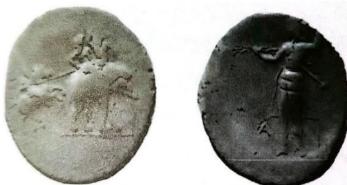
شکل ۹: سکه‌ای منحصر به فرد از سلوکوس اول با نقش اسکندر سوار بر فیل (Hill, 1922: pl. XXII)