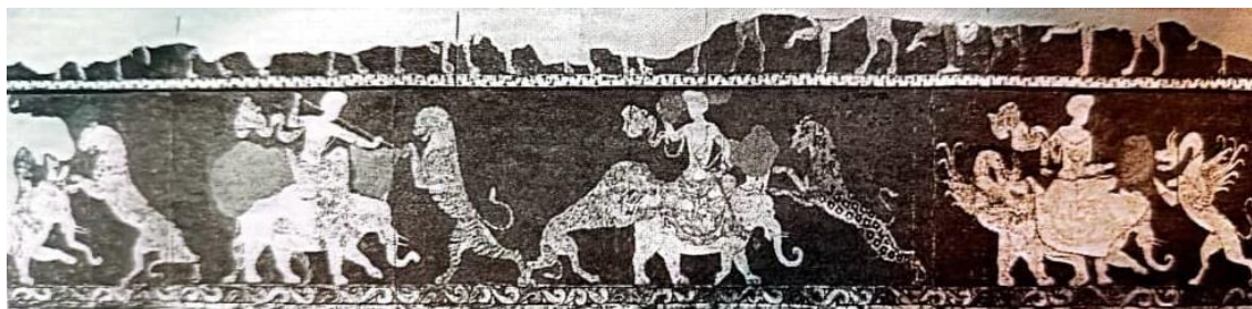
شکل ۷: شکار صاحب‌منصب سغدی سوار بر فیل (The State Hermitage Museum)

در منطقه سغد، نقاشی‌های دیواری به‌عنوان یکی از مهم‌ترین عناصر تزئینی فضاهای معماری شناخته می‌شد؛ این نگاره‌ها اگرچه گاهی خارج از جغرافیای سیاسی شاهنشاهی ساسانی واقع بوده‌اند، اما شباهت‌های سبکی و محتوایی بسیار نزدیکی با سنگ‌نگاره‌ها و نقاشی‌های دیواری مناطق داخلی ایران را نشان می‌دهد. یکی از این نگاره‌ها که در ورخشا (بخارا) یافت شده است، صحنه شکاری را نمایش می‌دهد که یک شکارچی روی فیل بزرگ با زینی مجلل نشسته است (شکل ۷). در چند صحنه حیواناتی شبیه پلنگ به سوی فیل یورش آوردند (Mongait, 1959: 288-289). این صحنه مشابه تمامی صحنه‌های شکار منتسب به شاهان ساسانی روی بشقاب‌های نقره و طلاوندود این دوره است. علاوه بر این مشابه نقشمایه‌های مرتبط به شکار با فیل روی تابوت مرمری یوهونگ است که شرح آن در بالا ارائه شد. حضور حیوانات اسطوره‌ای چون اژدها از دو منظر قابل بررسی است. نخست آنکه این تصاویر شاه آرمانی به حوزه اسطوره‌ها ورود کرده است و دوم آنکه تأثیرات چینی منطقه سغد بر هنرهای تجسمی را به نمایش می‌گذارد.