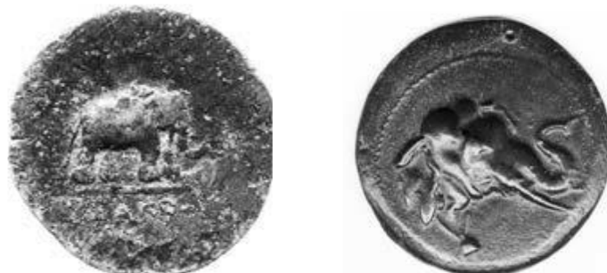
شکل ۱۰-۱۱: نقش فیل پشت سکه دمتریوس اول (the British Museum) و نقش فیل پشت سکه مهرداد اول (the British Museum)