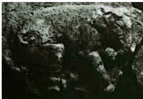
شکل ۳: گچبری فیل در تل داورز عراق (کروگر، ۱۳۹۶: ص ۷۶: ۳)

از محوطه تل داورز در شرق شهر سویره در ۳۰ کیلومتری مداین صفحات چهارگوش گچبری مزین به اسب بالدار و فیل به دست آمد که نشان از وجود یک عمارت اشرافی ساسانی در این منطقه دارد (شکل ۳). گوش فیل‌ها در این گچبری‌ها، همانند فیل‌های هندی کوچک بوده و خرطوم به سمت سینه متمایل شده و سر آن به سمت بالا برگشته است (کروگر، ۱۳۹۶: ۲۸۵-۲۸۷). یکی از سنت‌های گچبری ساسانی بهره‌گیری از مضامین مذهبی و حتی اساطیری مرتبط با دین زرتشتی است. در اغلب گچبری‌های حیوانی این دوره تجسم‌های حیوانی ایزد بهرام به خوبی قابل مشاهده هستند. اگرمن کوشش نمود فیل را نیز یکی از تجسم‌های ده گانه این ایزد حداقل از نیمه دوم دوره ساسانی معرفی کند (Ackerman, 1940: 235). از آنجا که اسب‌ها، قوچ‌ها و هم‌چنین گراز و پرندگان از مصادیق این تجسم‌بخشی حیوانی در هنر گچبری ساسانی به‌شمار می‌روند، فیل می‌تواند یکی از حیوانات محبوب مرتبط با ایزد بهرام که حافظ نهاد پادشاهی در ایران باستان بوده است، در نظر گرفته شود و در گچبری‌ها در کنار دیگر تجسم‌های حیوانی ایزدان حامی پادشاهی، حضور یابد.