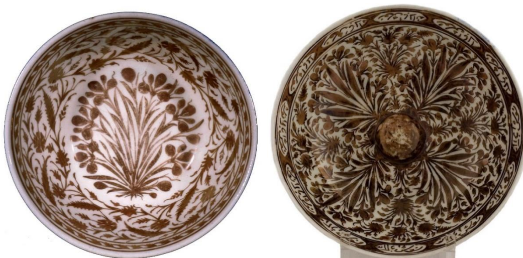
شکل ۳۱: دو نمونه سفال زرین‌فام تکرنگ سده ۱۰-۱۱ ه.ق، سمت راست: موزه بریتانیا با شماره اثر G.405 و سمت چپ: موزه ملی ایران با شماره اثر ۲۱۴۲۲