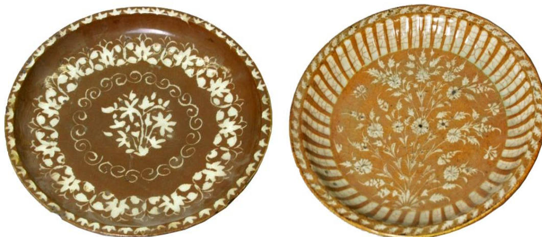
شکل ۲۶: دو نمونه از سفال نقاشی زیر لعاب در گلابه قهوه‌ای روشن، سده ۱۱ ه.ق، احتمالاً تولید کرمان، موزه بروکلین با شماره اثر CUR.86.227.193 و CUR.42.212.35