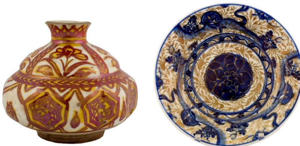
شکل ۳۲: نمونه‌هایی از ظروف زرین‌فام دورنگ زیرلعابی و رولعابی، سده ۱۰-۱۱ ه.ق، سمت راست: موزه بریتانیا با شماره اثر 1894,0219.1 و سمت چپ: موزه بریتانیا با شماره اثر 89583001

سفال زرین‌فام در زمینه رنگی: این شیوه تزئینی نیز تا حد زیادی مشابه نمونه‌های سده‌های میانی اسلامی است که در آن از تکرنگ طلایی متمایل به قرمز برای نقش‌اندازی در زمینه‌ای به رنگ لاجوردی استفاده شده است. لازم به ذکر است که این سفال‌ها اغلب با نام لاجوردی-زرین‌فام شناخته شده‌اند. البته در مواردی رنگ زمینه لاجوردی تا حدودی تغییر کرده و از رنگ‌های لاجوردی روشن، لاجوردی متمایل به بنفش و گاه فیروزه‌ای استفاده شده است. نقوش استفاده شده در این سفال‌ها تفاوت چندانی با نمونه‌های زرین‌فام ندارند و بیشتر از اشکال گیاهی و در موارد معدودی جانوری، برای نقش‌اندازی استفاده شده است. این سفال‌ها اغلب در بازه زمانی سده ۱۱ ه.ق تولید شده‌اند؛ اما در حال حاضر هیچ مرکز معتبری که این سفال در آن تولید شده باشد، شناسایی نشده است (شکل ۳۳).