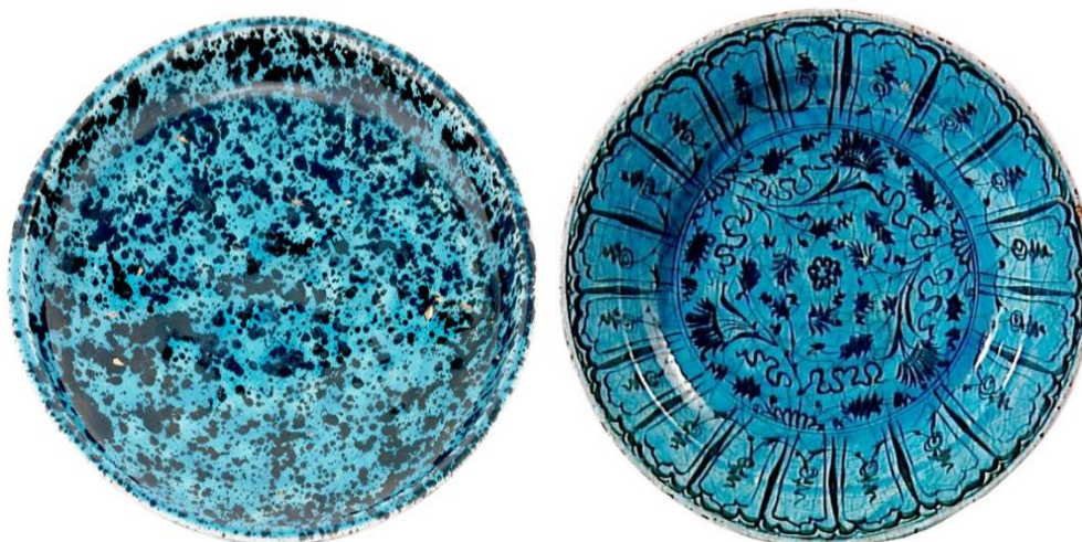
شکل ۲۸: سفال گونه دوم کوباچه متأخر، سده ۱۰-۱۱ ق. موزه ملی Adrien Dubouché با شماره 471 در سمت راست و سفال پاشیده لکه‌ای زیر لعاب فیروزه‌ای، سده ۱۱-۱۲ ق. موزه فریبیر با شماره S1997.68 در سمت چپ

سفال‌های پاشیده لکه‌ای زیر لعاب فیروزه‌ای: این گونه سفالین از نمونه‌های کمتر رایج این دوران محسوب می‌شود. در این شیوه تزئینی نقوشی به‌صورت پاشیده لکه‌ای خال‌مانند و به رنگ سیاه، روی بدنه سفال پاشیده یا پخش می‌شود، سپس یک لایه لعاب شفاف فیروزه‌ای رنگ کل بدنه سفال را در بر می‌گیرد. این شیوه تزئینی در انواع ظروف دهانه‌باز و بسته به‌کار رفته و تاریخ سده ۱۱-۱۲ ق. برای آن در نظر گرفته شده است (شکل ۲۸). از جمله مراکزی که این گونه سفالین در آن شناسایی شده می‌توان به محوطه ذلف‌آباد فراهان (شراهی، ۱۳۸۷: ۲۱۵)، اشاره کرد. تاکنون هیچ مرکز معتبری برای تولید این گونه سفالی شناسایی نشده است.