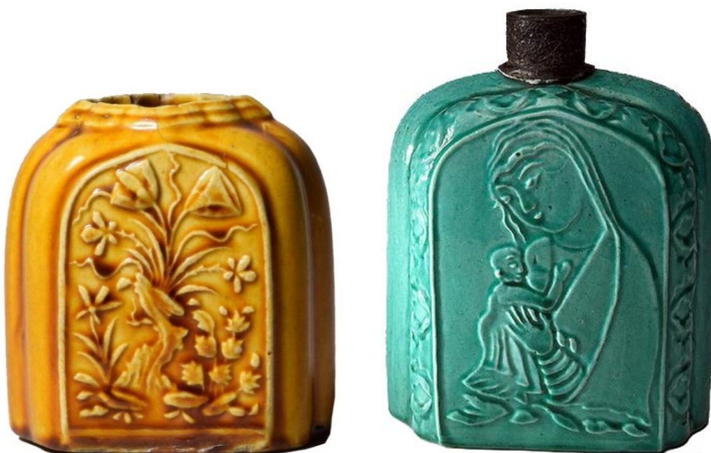
شکل ۹: نمونه‌هایی از ظروف قالبی لعاب‌دار تک‌رنگ با خمیره فریتی، سده ۱۱ ه.ق، موزه ارمیتاژ با شماره اثر VI-2354 و موزه ویکتوریا و آلبرت با شماره اثر 1354A-1876

و روی خمیره نقوشی به صورت قالبی یا گاه تراشی اجرا شده است. در نهایت یک لایه لعاب تک‌رنگ فیروزه‌ای، سبز تیره، سفید یا قهوه‌ای روشن، روی سفال را فرا گرفته است. در این ظروف بیشتر از نقوش جانوری در ترکیب با نقوش گیاهی استفاده شده؛ اما در مواردی تنها دارای نقوش گیاهی یا هندسی هستند. این نقوش گاه مشابه نقاشی‌های پیکره‌ای سبک اصفهان هستند که در طرح‌های سایر ظروف سفالی این دوره، همچون کوباچه‌های هفت‌رنگ، نیز دیده می‌شود. این ظروف اغلب در بازه نیمه نخست سده ۱۱ ه.ق تولید و شناخته شده‌اند؛ اما مرکز تولیدی آن‌ها مشخص نیست؛ هر چند که به اعتقاد برخی از پژوهشگران، شهر اصفهان یکی از مراکز تولیدی این گونه سفالین بوده است (Lane, 1971: 109)؛ (شکل ۹).