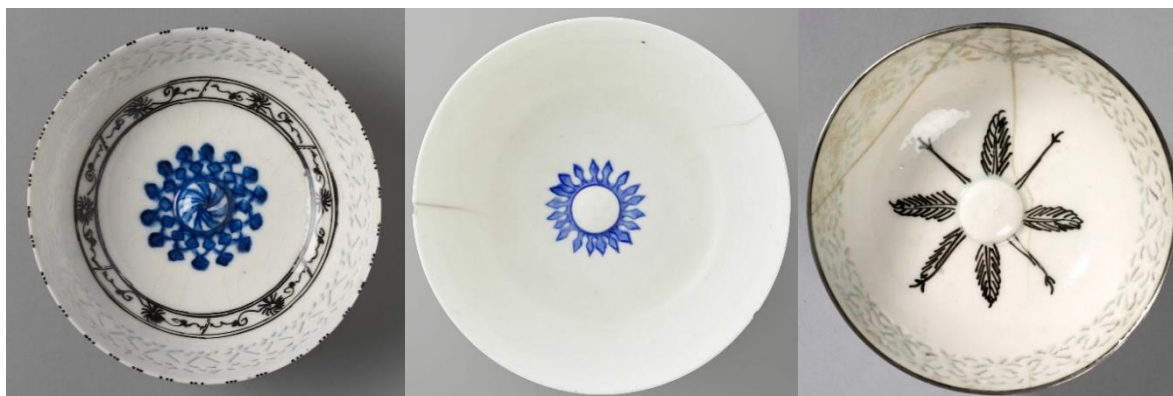
شکل ۱۶: سفال‌های گمبرون با تزئین نقاشی زیر لعاب؛ سده ۱۲ ه.ق، به ترتیب از سمت راست به چپ: موزه رویال اونتاریو با شماره اثر ROM2007-9547-8، موزه لوور با شماره اثر A 7786 و موزه هنر آسیایی با شماره اثر B60P2300