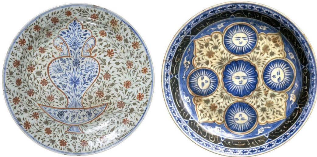
شکل ۲۲: سفال آبی و سفید-منقوش دو رنگ، احتمالاً تولید کرمان، سمت راست با تاریخ ۱۰۸۴ه.ق، موزه دیوید با شماره اثر 4/1986 و سمت چپ موزه ویکتوریا و آلبرت با شماره اثر 870-1876

سفال آبی و سفید - منقوش تک‌رنگ/دو رنگ: این گونه سفالی در اصل ترکیبی از دو سبک مختلف نقش‌پردازی است که شامل آبی و سفید رایج صفوی و نقاشی دو رنگ قرمز و سبز روشن یا تک‌رنگ قرمز مایل به سبز (یا طلایی زیتونی) در زیر لعاب شفاف و بی‌رنگ می‌شود. با این توضیح که بخش‌هایی از بدنه ظروف با شیوه آبی و سفید طراحی شده و در میانه آن‌ها از نقاشی دو رنگ قرمز و سبز روشن یا تک‌رنگ قرمز مایل به سبز (یا طلایی زیتونی) نیز استفاده شده است. در نهایت یک لایه لعاب شفاف و غلیظ بی‌رنگ قلیایی، روی بدنه سفال را فرا گرفته است. در موارد معدودی علاوه بر تزئینات زیر لعابی، از نقوش سایه‌نما، در بخش‌های اندکی از بدنه ظرف، استفاده می‌شده است (Golombek, 2003: 262 و Fehervari, 2000: 288). این سفال‌ها بیشتر فرم دهانه‌باز، همچون کاسه و بشقاب، دارند، اما در مواردی نیز دهانه‌بسته هستند، همچون کوزه بطری یا کوزه قلیان. نقوش به‌کار رفته در آن‌ها بیشتر گیاهی و تا حدودی هندسی بوده اما موارد معدودی با نقوش جانوری یا کتیبه‌دار نیز شناسایی شده است. این شیوه تزئینی در بازه نیمه دوم سده ۱۱ه.ق تا نیمه اول سده ۱۲ه.ق تولید شده است. از جمله قدیمی‌ترین ظروف تاریخ‌دار با این شیوه تزئینی مربوط به سال ۱۰۸۴ه.ق است که امروزه در موزه دیوید دانمارک نگهداری می‌شود. با توجه به تشابهات بسیار نقوش این گونه سفالی با سایر گونه‌های منسوب به کرمان، سفالینه‌های این گروه نیز احتمالاً در شهر کرمان تولید شده‌اند (روحانی و همکاران، ۱۴۰۰: ۵۱؛ Lane, 1971: 83 و Golombek, 2003: 256)؛ (شکل ۲۲).