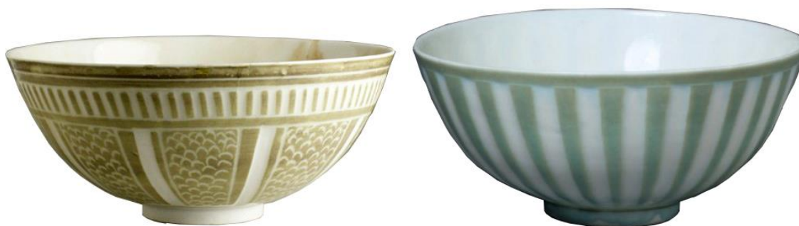
شکل ۱۲: سفال با تکنیک سایه‌نما، گونه ۲، سده ۱۱ ه.ق، سمت راست با گلابه سبز زیتونی روشن، موزه ویکتوریا و آلبرت با شماره اثر 2862-1876 و سمت چپ با گلابه کرمی‌رنگ، موزه هنر شیکاگو

گروه بعدی سفال‌های سایه‌نما را نمونه‌های با گلابه سیاه‌رنگ در زیر لعاب سفید شفاف یا فیروزه‌ای روشن، تشکیل می‌دهند. سفالینه‌های این گونه نیز تاکنون به‌ندرت شناسایی شده‌اند. در این گونه تزئینی از یک لایه گلابه سیاه‌رنگ روی خمیره سفید فریتی استفاده شده، سپس بخش‌هایی از گلابه با نقش تراشی برش داده شده و در نهایت یک لایه لعاب فیروزه‌ای روشن شفاف یا سفید، روی بدنه سفال اجرا شده است. این گونه تزئینی نیز با توجه به اطلاعات موجود در وبسایت موزه‌های مختلف، بیشتر در بازه سده ۱۱ ه.ق تولید و شناخته شده اما مرکز یا مراکز اصلی تولیدی آن مشخص نیست. لازم به ذکر است که گاه این شیوه تزئینی در ترکیب با تزئینات دیگر به‌کار رفته است؛ با این توضیح که در برخی سفالینه‌های دهانه‌باز، گاه از این شیوه در بدنه خارجی استفاده شده و بدنه داخلی ظرف دارای تزئینات دیگری همچون آبی و سفید است (شکل ۱۳).