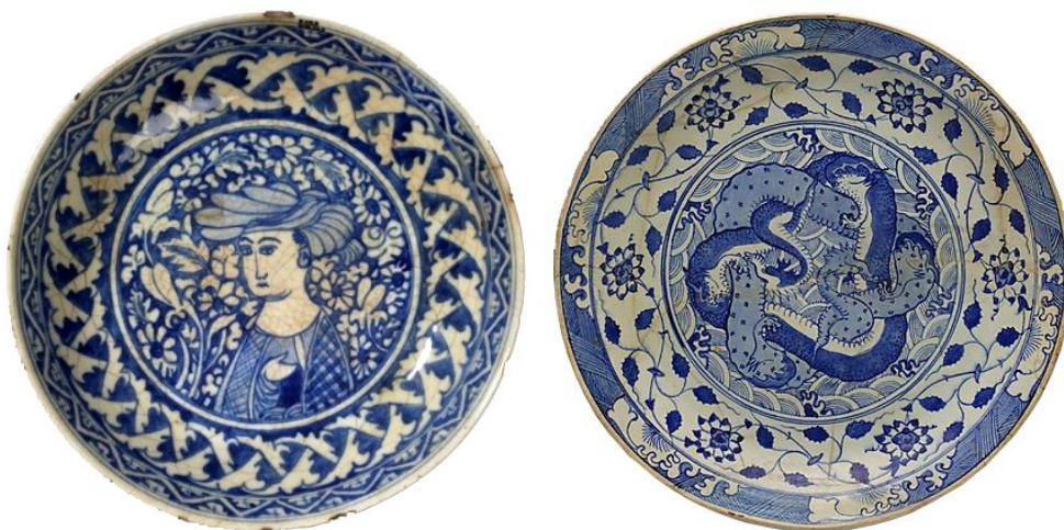
شکل ۲۰: نمونه‌هایی از سفال آبی و سفید سده ۱۰-۱۱ ه.ق، سمت راست: احتمالاً تولید کرمان، تاریخ ۱۰۴۹ ه.ق، موزه متروپولیتن با شماره اثر 65.109.2 و سمت چپ: احتمالاً تولید اصفهان، موزه روبال اونتاریو با شماره اثر DSC04697

و در اروپا به فروش رساندند (شاردن، ۱۳۳۶: ۳۴۰). البته تولیدات کرمان و مشهد تفاوت‌های اندکی نیز با هم دارند. از آن جمله می‌توان به رنگ تیره‌تر آبی کبالتی، سختی بیشتر بدنه تولیدات مشهد نسبت به کرمان و از طرفی استفاده از قلم‌گیری سیاه در برخی از تولیدات آبی و سفید کرمان، اشاره کرد (محمدی‌فر و بلمکی، ۱۳۸۷: ۹۸؛ اکبری و صادقی طاهری، ۱۳۹۳: ۸۶؛ روحانی و همکاران، ۱۴۰۰: ۵۰؛ Golombek, 2003: 262-263 و Mason & Golombek, 2003: 278). یکی از دلایل تشابه سفال‌های آبی و سفید ایران و چین در طول دوره صفوی، حضور و سکونت هنرمندان سفال‌گر چینی در برخی از مراکز ایران بوده است. این افراد شیوه‌های مختلف تولید و نقش‌پردازی سفال را به هنرمندان سفالگر ایرانی آموزش می‌دادند (سیوری، ۱۳۶۳: ۱۲۵). این سفال‌ها از لحاظ نوع فرم و شیوه نقش‌پردازی تا حدی مشابه نمونه‌های چینی بوده؛ اما گاه کتیبه‌هایی به زبان فارسی روی آن‌ها نگاشته شده است (شکل ۲۰ و ۲۱).