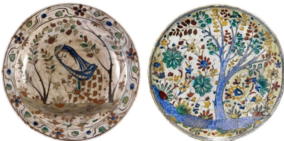
شکل ۱۸: سفال کوباچه متأخر رنگارنگ با نقوش گیاهی و انسانی، نیمه دوم قرن ۱۰ تا نیمه اول قرن ۱۱ ق. سمت راست: موزه ملی ایران با شماره اثر ۳۴۱۵ و سمت چپ: موزه لوور با شماره اثر AD 27780

سفال آبی و سفید-کوباچه: این شیوه تزئینی ترکیبی از نقاشی زیر لعاب آبی و سفید تک‌رنگ و کوباچه رنگارنگ بوده که باعث پدید آمدن طرح زیبا و متفاوتی روی ظروف سفالین شده است. این شیوه تزئینی تنها در ظروف دهانه‌باز همچون دیس یا بشقاب اجرا شده است. این گونه سفالین اغلب در سده ۱۱ ق. تولید شده و شهر اصفهان، یکی از مراکز اصلی احتمالی تولید چنین ظروفی بوده است (شکل ۱۹).