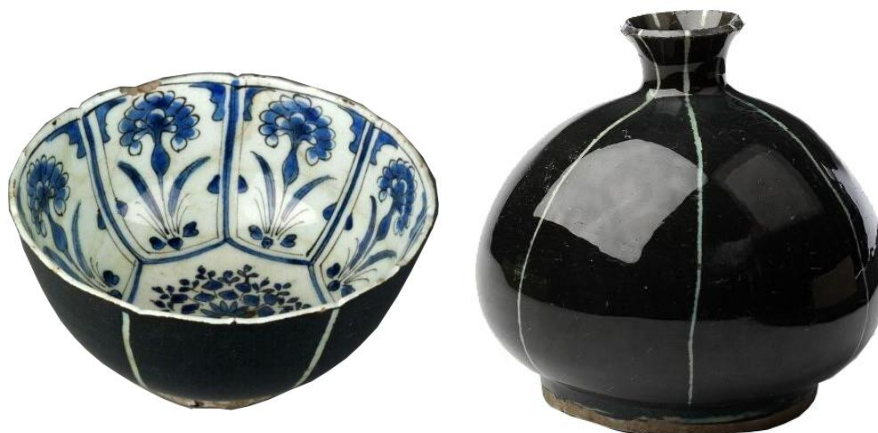
شکل ۱۳: سمت راست: سفال سایه‌نما با گلابه سیاه زیر لعاب فیروزه‌ای روشن، سده ۱۱ ه.ق، موزه ویکتوریا و آلبرت با شماره اثر 1309-1876 و سمت چپ: نمونه ترکیبی سایه‌نما و آبی و سفید دورنگ، سده ۱۰-۱۱ ه.ق، موزه ویکتوریا و آلبرت با شماره اثر 195-1884

گروه بعدی سفال‌های سایه‌نما را نمونه‌های با گلابه سیاه‌رنگ در زیر لعاب سفید شفاف یا فیروزه‌ای روشن، تشکیل می‌دهند. سفالینه‌های این گونه نیز تاکنون به‌ندرت شناسایی شده‌اند. در این گونه تزئینی از یک لایه گلابه سیاه‌رنگ روی خمیره سفید فریتی استفاده شده، سپس بخش‌هایی از گلابه با نقش تراشی برش داده شده و در نهایت یک لایه لعاب فیروزه‌ای روشن شفاف یا سفید، روی بدنه سفال اجرا شده است. این گونه تزئینی نیز با توجه به اطلاعات موجود در وبسایت موزه‌های مختلف، بیشتر در بازه سده ۱۱ ه.ق تولید و شناخته شده اما مرکز یا مراکز اصلی تولیدی آن مشخص نیست. لازم به ذکر است که گاه این شیوه تزئینی در ترکیب با تزئینات دیگر به‌کار رفته است؛ با این توضیح که در برخی سفالینه‌های دهانه‌باز، گاه از این شیوه در بدنه خارجی استفاده شده و بدنه داخلی ظرف دارای تزئینات دیگری همچون آبی و سفید است (شکل ۱۳).