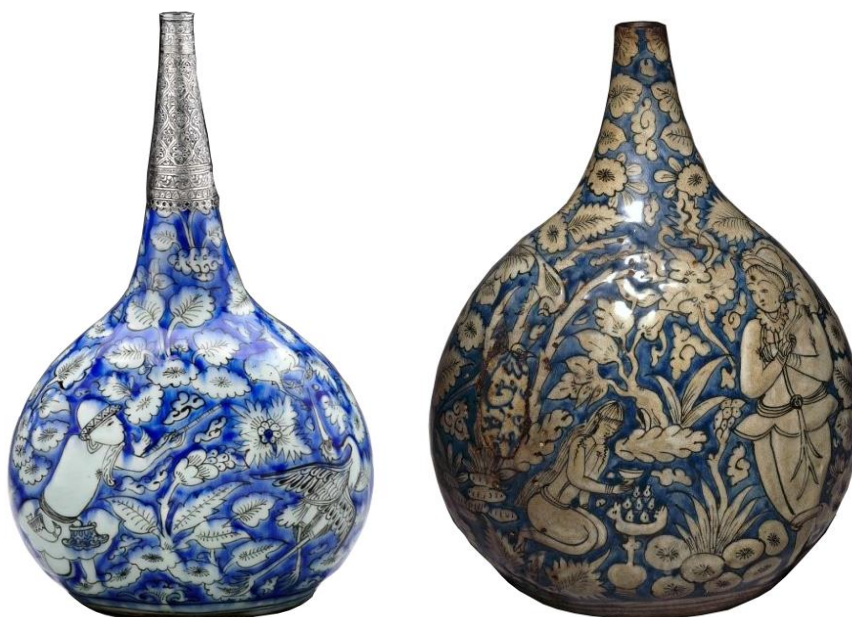
شکل ۲۱: نمونه‌هایی از سفال‌های آبی و سفید سده ۱۰-۱۱ ه.ق، احتمالاً تولید مشهد، موزه بروکلین با شماره 34.6024 و موزه هنرهای ظریفه بوستون با شماره اثر SC285314