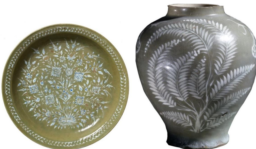
شکل ۲۵: سفالینه نقاشی سفید زیر لعاب تک‌رنگ یا دورنگ، شبه‌سلادون، احتمالاً تولید کرمان، سده ۱۱ ه.ق، سمت راست: موزه بریتانیا با شماره اثر 1896,0626.3 و سمت چپ: موزه دیوید با شماره اثر 16/2010

سفال نقاشی در گلابه سبز روشن زیر لعاب بی‌رنگ (شبه‌سلادون): در این شیوه تزئینی، ابتدا روی خمیره سفید فریتی با یک لایه گلابه سبز روشن یا سبز شبه‌سلادون پوشانده و سپس با استفاده از رنگ سفید نقوش بسیار ظریف گیاهی یا هندسی، روی ظرف طراحی شده است. در مرحله بعد، در بخش‌های اندکی از طرح‌های کشیده شده، از رنگ آبی کبالتی به صورت نقوش خال‌مانند یا نواری غلیظ، استفاده می‌شود. البته استفاده از رنگ آبی کبالتی در همه ظروف این گونه تزئینی به کار نرفته و مواردی نیز به صورت تک‌رنگ سفید هستند. در نهایت نیز یک لایه لعاب غلیظ و شفاف بی‌رنگ روی کل بدنه ظرف را در بر می‌گیرد. این شیوه تزئینی بیشتر در ظروف دهانه‌باز، مانند بشقاب، به کار رفته؛ اما مواردی نیز با فرم دهانه‌بسته شناسایی شده‌اند. با توجه به شواهد موجود چنین به نظر می‌رسد که این شیوه تزئینی بیشتر در بازه سده ۱۱ ه.ق تولید شده و از جمله مراکزی که برای تولید این ظروف معرفی شده، می‌توان به شهر کرمان اشاره کرد (Fehrevari, 2000: 277 و Pope, 1977: 1659). هر چند که تاکنون هیچ شواهد متقنی از کارگاه‌های تولید این سفال در کاوش‌های باستان‌شناسی این شهر به دست نیامده است (شکل ۲۴).