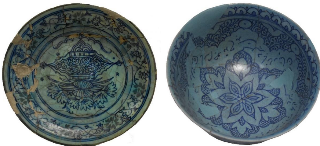
شکل ۳۰: نمونه‌هایی از سفال‌های با تزئین نقاشی آبی کبالتی زیر لعاب فیروزه‌ای یا آبی روشن، آذربایجان و اصفهان، سده ۱۱ ه.ق، محل نگهداری: موزه ملی ایران با شماره ثبت ۳۹۸۰ و ۳۷۶۰

سفال نقاشی آبی کبالتی زیر لعاب فیروزه‌ای یا آبی روشن: سفال‌های این گروه خمیره سفید فریتی نازک دارند و با تکنیک چرخ‌ساز ساخته شده‌اند. در این سفال‌ها از تزئینات آبی کبالتی در زیر لعاب فیروزه‌ای روشن یا آبی روشن استفاده شده است. نقوش به‌کار رفته در آن‌ها شامل اشکال مختلف گیاهی، هندسی و کتیبه‌دار به خط نسخ تحریری یا نستعلیق است. این سفال‌ها از فراوانی بسیار اندکی برخوردار بوده و تاکنون تنها قطعات پراکنده‌ای از آن در برخی محوطه‌ها همچون قلعه‌سنگ سیرجان، دژ لشتان و برخی دیگر از محوطه‌های کرانه‌های شمالی خلیج فارس، شناسایی شده است (امیرحاجلو و صدیقیان، ۱۳۹۹: ۱۷۰؛ وثوقی و همکاران، ۱۴۰۰ و Priestman, 2005: p412, plate161). نمونه‌هایی از این سفال‌ها در موزه ملی ایران وجود دارد که به مراکزی همچون اصفهان و تبریز منسوب هستند (شکل ۳۰). با توجه به ویژگی‌های تزئینی به‌کار رفته در این سفال‌ها و اطلاعات موجود در برخی موزه‌ها، احتمالاً در بازه زمانی سده ۱۱ ه.ق، تولید شده و مورد استفاده قرار گرفته‌اند؛ در عین حال مرکز تولیدی آن‌ها نامشخص است.