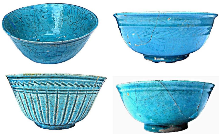
شکل ۳: نمونه‌هایی از سفال‌های لعاب‌دار تک‌رنگ فیروزه‌ای تولید شده در شهر اردبیل، سده ۱۰-۱۱ ه.ق (یوسفی، ۱۳۸۵)

در طول این دوره، علاوه بر موارد ذکر شده، گونه‌های دیگری از سفالینه‌های لعاب‌دار تک‌رنگ خمیره رسی تولید شده است که از آن جمله می‌توان به «سفال با لعاب تک‌رنگ لکه‌دار یا آبی لکه‌دار ایرانی ۱ »، اشاره کرد (شکل ۴). این سفال خمیره رسی نخودی مایل به قرمز با آمیزه ماسه‌بادی دارد و با تکنیک چرخ‌ساز ساخته شده است. فرم این سفال‌ها اغلب دهانه‌باز و شامل اشکال مختلفی همچون بشقاب یا قح بوده است. قسمت بالایی لبه این سفال‌ها از سمت داخل ظرف یک زاویه مایل و متمایل به بیرون دارند؛ فرم خاصی از لبه که در دیگر نمونه‌های این دوره شناسایی نشده است. بدنه این سفالینه‌ها با یک لایه لعاب غلیظ تک‌رنگ سبز تیره تا خاکستری روشن یا آبی تیره، پوشانده شده است. پوشش لعاب به واسطه داشتن ناخالصی‌های ریزدانه بسیار، بافت آن به صورت نقطه‌نقطه‌ای دیده می‌شود (Priestman, 2005: 270-271). این گونه سفالی در مناطق جنوبی ایران همچون قلعه لشتان (وثوقی و همکاران، ۱۴۰۰: ۲۷۲) و جزیره قشم (خسروزاده، ۱۳۹۱: ۶۰۳)، شناسایی شده است. برخی از پژوهشگران، این گونه سفالی را «شبه‌سلاون» معرفی کرده‌اند (Hansman, 1985: 52). به‌طور کلی تاریخی که برای این گونه سفالین در نظر گرفته شده، سده ۹ تا ۱۱ ه.ق است (Ibid). همین امر نشان می‌دهد که احتمالاً روند تولید برخی از سفالینه‌ها، قبل از دوره صفوی شروع شده و تا دوره صفوی نیز ادامه داشته است. مرکز تولیدی این گونه سفالین نیز مشخص نیست اما احتمال می‌رود در همان نیمه جنوبی ایران تولید شده باشد.