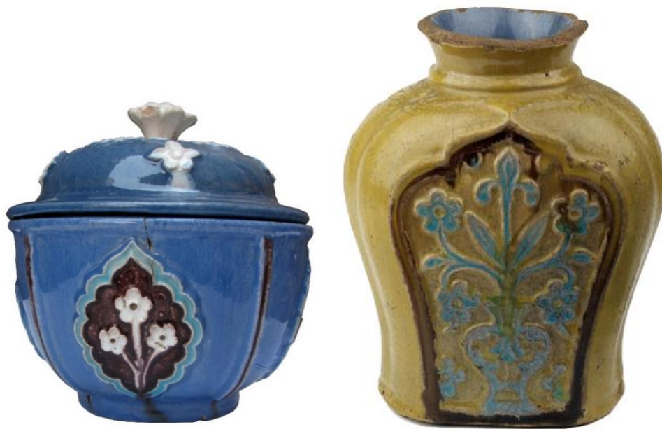
شکل ۲۹: نمونه‌هایی از سفال‌های با تکنیک قالبی-نقاشی زیر لعاب در گلابه رنگی، سده ۱۱-۱۲ ه.ق، سمت راست: موزه ویکتوریا و آلبرت با شماره اثر 973-1886 و سمت چپ: به‌دست آمده از کاوش‌های اردبیل (یوسفی، ۱۳۸۵)

سفال نقاشی آبی کبالتی زیر لعاب فیروزه‌ای یا آبی روشن: سفال‌های این گروه خمیره سفید فریتی نازک دارند و با تکنیک چرخ‌ساز ساخته شده‌اند. در این سفال‌ها از تزئینات آبی کبالتی در زیر لعاب فیروزه‌ای روشن یا آبی روشن استفاده شده است. نقوش به‌کار رفته در آن‌ها شامل اشکال مختلف گیاهی، هندسی و کتیبه‌دار به خط نسخ تحریری یا نستعلیق است. این سفال‌ها از فراوانی بسیار اندکی برخوردار بوده و تاکنون تنها قطعات پراکنده‌ای از آن در برخی محوطه‌ها همچون قلعه‌سنگ سیرجان، دژ لشتان و برخی دیگر از محوطه‌های کرانه‌های شمالی خلیج فارس، شناسایی شده است (امیرحاجلو و صدیقیان، ۱۳۹۹: ۱۷۰؛ وثوقی و همکاران، ۱۴۰۰ و Priestman, 2005: p412, plate161). نمونه‌هایی از این سفال‌ها در موزه ملی ایران وجود دارد که به مراکزی همچون اصفهان و تبریز منسوب هستند (شکل ۳۰). با توجه به ویژگی‌های تزئینی به‌کار رفته در این سفال‌ها و اطلاعات موجود در برخی موزه‌ها، احتمالاً در بازه زمانی سده ۱۱ ه.ق، تولید شده و مورد استفاده قرار گرفته‌اند؛ در عین حال مرکز تولیدی آن‌ها نامشخص است.