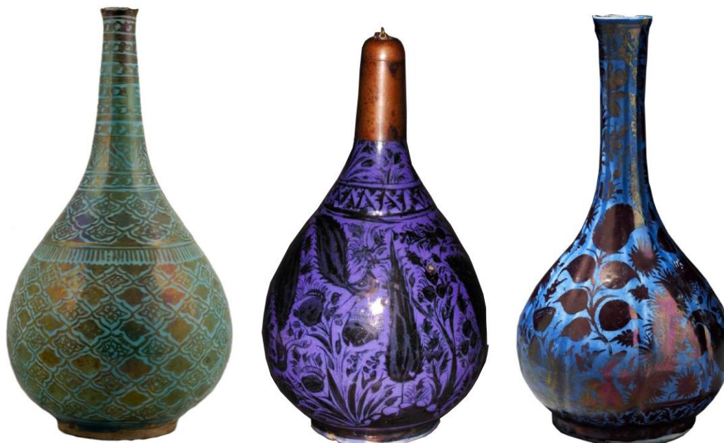
شکل ۳۳: نمونه‌های مختلفی از ظروف زرین‌فام با زمینه رنگی، سده ۵۱۱ ه.ق. موزه آشمولین با شماره اثر EAX.3080، موزه فیتز با شماره اثر C.140-1935 و موزه بریتانیا با شماره اثر G.397