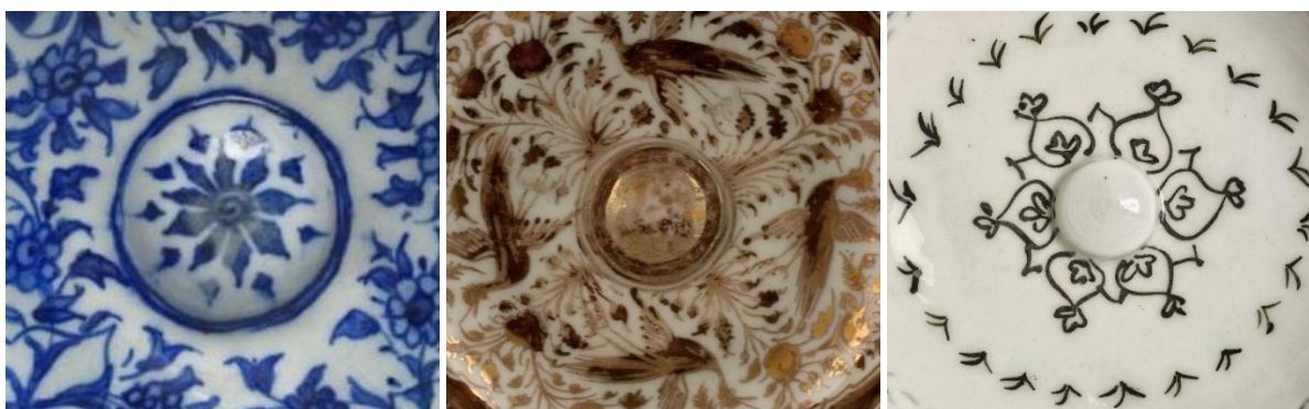
شکل ۱۷: نقش برجسته دگمه‌ای شکل مرکز سفال گمبرون و مشابه آن در تزئین زرین‌فام و آبی و سفید صفوی

سفال کوباجه متاخر (گونه ۱): شاخص‌ترین و شناخته‌شده‌ترین سفالینه‌های کوباجه را همین گونه تشکیل می‌دهد که در بازه سده ۱۰ و ۱۱ ه.ق تولید شده است. سفالینه‌های گونه اول کوباجه متاخر با تکنیک نقاشی رنگارنگ زیر لعاب شفاف و بی‌رنگ، ساخته و پرداخت شده‌اند؛ البته در موارد بسیار معدودی، از لعابی به رنگ آبی روشن و شفاف برای پوشش ظرف نیز استفاده شده است. رنگ‌های استفاده شده برای نقش‌پردازی این سفال‌ها شامل اخراپی، قهوه‌ای، آبی، فیروزه‌ای، سبز، سفید، سیاه، زرد و کرم است. این سفالینه‌ها اغلب فرم دهانه‌باز، مثل اشکال مختلف کاسه یا دیس، دارند؛ اما نمونه‌های معدودی با فرم دهانه‌بسته نیز شناسایی شده است (مهجور، ۱۳۹۷: ۱۸-۱۹). در این سفال‌ها انواع مختلف نقوش گیاهی، جانوری و هندسی به کار رفته است؛ اما یکی از شاخصه‌های تزئینی این سفال‌ها استفاده از نقوش خال‌مانند یا لکه‌ای با رنگ‌های مختلف بوده که معمولاً غلظت زیادی داشته و زیر لعاب اندکی برجسته‌تر شده است. در برخی از سفالینه‌های این گونه نقوش پیکره‌ای زنان به کار رفته که شیوه نقاشی آن‌ها به سبک اصفهان بوده است. از این روی احتمال داده می‌شود که برخی از سفالینه‌های این گونه در شهر اصفهان تولید شده باشند؛ هر چند که در حال حاضر نه در این شهر و نه در سایر مناطق ایران، شواهد متقنی از تولید این گونه به‌دست نیامده است (شکل ۱۸). در حال حاضر نمونه‌های فراوانی از این گونه سفالین در کاوش‌ها یا بررسی‌های باستان‌شناسی مناطق مختلف ایران شناسایی شده است. از جمله می‌توان به این موارد اشاره کرد: محوطهٔ نچیر خانلق شهر ری (مهجور و همکاران، ۱۳۹۰: ۱۸۶؛ کانینگهام و همکاران، ۱۳۹۰: ۲۳۲)؛ قلعهٔ الموت (مهجور، ۱۳۹۷: ۲۷) و تپه نرگهٔ تاکستان (مهجور، ۱۳۹۷: ۳۶-۳۷).