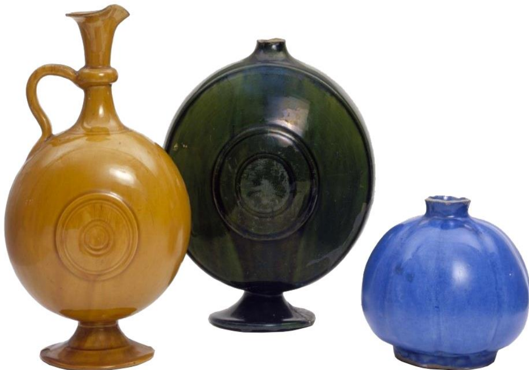
شکل ۶: نمونه‌های مختلفی از سفال‌های لعاب‌دار تک‌رنگ ساده خمیره فریتی، سده ۱۰-۱۱ ه.ق، موزه ویکتوریا و آلبرت

در سفال‌های لعاب‌دار تک‌رنگ ساده انواع متنوعی از رنگ‌های لعاب به کار رفته که از جمله آن‌ها می‌توان به این موارد اشاره کرد: قهوه‌ای روشن یا تیره، فیروزه‌ای، سبز تیره، سبز زیتونی، کرم، سیاه، آبی روشن و لاجوردی. این سفال‌ها اغلب در بازه سده‌های ۱۰-۱۱ ه.ق تولید شده‌اند اما در حال حاضر هیچ مرکز تولیدی معتبری برای این گونه سفالین شناسایی نشده است. در این سفال‌ها گاه رنگ‌هایی همچون سبز زیتونی (شبه‌سلادون) و قهوه‌ای روشن نیز به کار رفته که تقلیدی از نمونه‌های مشابه چینی هستند (Fehervari, 2000: 277)؛ (شکل ۶ و ۷). مشابه برخی نمونه‌های لعاب‌دار تک‌رنگ قهوه‌ای تیره و کرم از دوره صفوی در کاوش‌های کاخ جهان‌نمای ساری به دست آمده است (Razeghi Mansor, et al., 2021: 117).