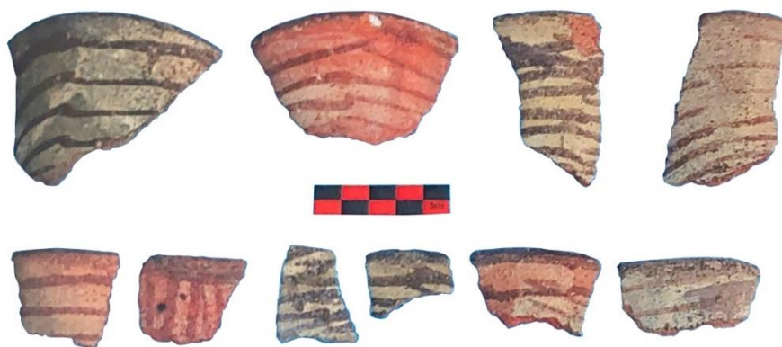
شکل ۱: نمونه‌هایی از سفال‌های جلفار متأخر، به‌دست آمده از قلعه‌لستان (وثوقی و همکاران، ۱۴۰۰: ۲۰۸)