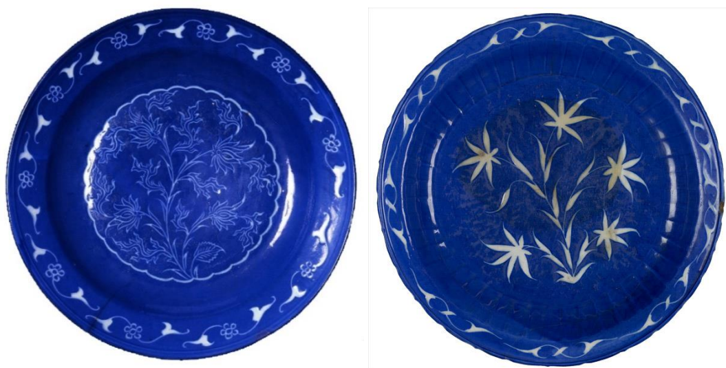
شکل ۱۱: سفال سایه‌نما با گلابه لاجوردی، احتمالاً تولید کرمان، سده ۱۱ ه.ق، موزه بریتانیا با شماره اثر 1970,0207.1 و موزه دیوید با شماره اثر 1/1986

یکی از گونه‌های شاخص سایه‌نما در این بازه زمانی، سفال سایه‌نمای آبی و سفید است. در این گونه، روی خمیره سفید فریتی، یک لایه گلابه لاجوردی رنگ غلیظ پیاده شده، سپس بخش‌هایی از گلابه با تکنیک نقش‌کنده با تراشی، برداشته شده تا زمینه سفید سفال مشخص گردد. در نهایت نیز یک لایه لعاب شفاف و بی‌رنگ غلیظ و با کیفیت، کل بدنه سفال را در بر گرفته است. این سفال‌ها اغلب فرم دهانه‌باز، همچون بشقاب یا کاسه، دارد؛ اما موارد معدودی نیز با فرم دهانه‌بسته، شناسایی شده است. نقوش به‌کار رفته در آن‌ها بیشتر شامل اشکال مختلف گیاهی یا هندسی است. با توجه به اطلاعات موجود در وب‌سایت موزه‌ها، این گونه سفالی اغلب در بازه سده ۱۱ ه.ق تولید و شناخته شده است. از جمله مراکز تولیدی احتمالی آن نیز دو شهر کرمان و اصفهان، معرفی شده است (شکل ۱۱).