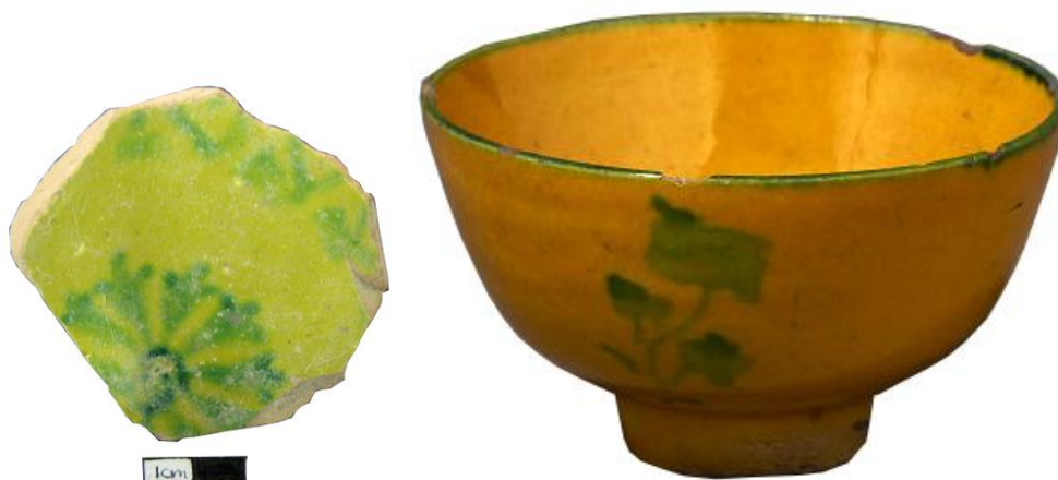
شکل ۲۷: دو نمونه سفال نقاشی سبز روشن زیر لعاب قهوه‌ای روشن یا زرد، سده ۱۱-۱۲ ه.ق، سمت راست: موزه ویکتوریا و آلبرت با شماره اثر 995-1883 و سمت چپ: به‌دست آمده از کاوش‌های مسجد جامع عتیق اصفهان

سفال نقاشی سبز روشن زیر لعاب قهوه‌ای روشن یا زرد: در حال حاضر نمونه‌های اندکی از این شیوه تزئینی شناخته شده است. در این شیوه ظروف کوچک‌اندازه‌ای، همچون پیاله، با خمیره سفید فریتی تولید شده که روی آن‌ها نقوش ساده گیاهی به رنگ سبز روشن کشیده شده و در نهایت یک لایه لعاب قهوه‌ای روشن یا زرد کل بدنه را فرا گرفته است. این سفال‌ها اغلب در بازه سده ۱۱-۱۲ ه.ق تاریخ‌گذاری شده و مرکز تولیدی معتبری برای آن‌ها شناسایی نشده است (شکل ۲۷).