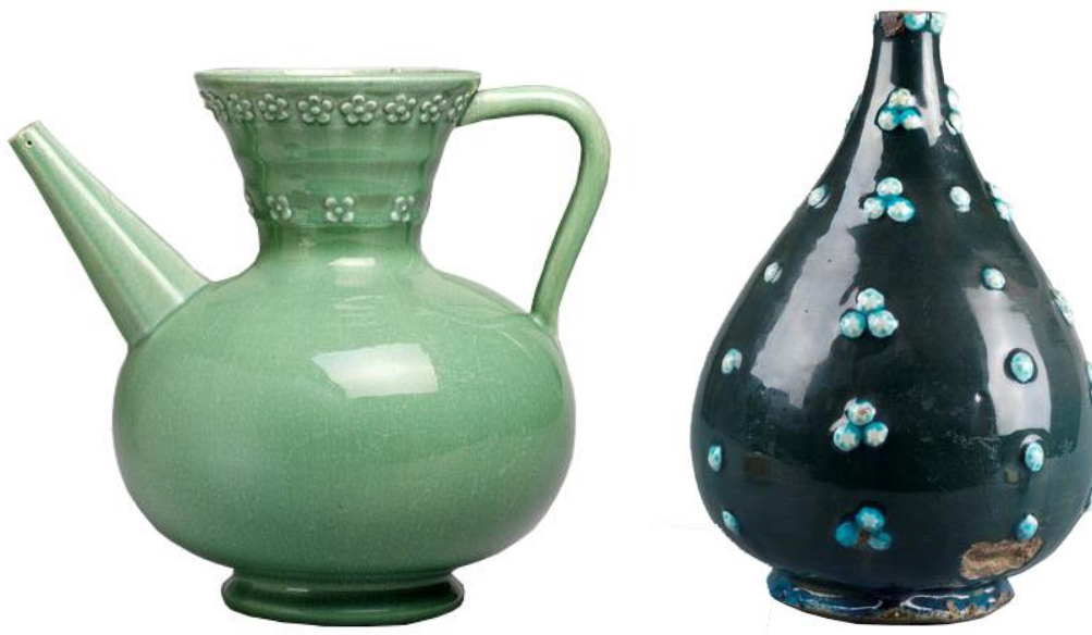
شکل ۸: نمونه‌هایی از ظروف لعاب‌دار تک‌رنگ با نقش افزوده برجسته یا نیم‌برجسته زیر لعاب، سده ۱۱ ه.ق، موزه ویکتوریا و آلبرت با شماره اثر 1110-1883 و 1311-1876

گروه دیگری از سفال‌های لعاب‌دار تک‌رنگ را نمونه‌های با نقش افزوده زیر لعاب تشکیل می‌دهند. این سفال‌ها از لحاظ تنوع فرم و رنگ لعاب تا حد زیادی مشابه گونه تک‌رنگ ساده هستند. اما در بخش‌های محدودی از این سفال‌ها نقوش افزوده دگمه‌ای شکل یا خال‌مانند با خمیره سفید فریتی، روی بدنه سفال اجرا شده است. این نقوش گاه شبیه به گل‌های پنج‌پر اجرا شده‌اند. این نقوش افزوده در بیشتر نمونه‌ها از ضخامت زیادی برخوردار نیستند اما در مواردی نیز کاملاً پهن و تا حدود قابل توجهی برجسته هستند. در کاتالوگ موزه‌ها، اغلب برای این شیوه تزئینی تاریخ سده ۱۱ ه.ق در نظر گرفته شده است؛ اما هیچ مرکز تولیدی برای این گونه سفالین معرفی نشده است (شکل ۸).