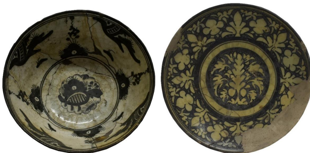
شکل ۲۳: سفال‌های نقاشی خاکستری زیر لعاب بی‌رنگ، سده ۱۱ ه.ق، ساوه، موزه ملی ایران با شماره اثر ۳۶۴۳ و ۳۶۲۵

سفال نقاشی در گلابه سبز روشن زیر لعاب بی‌رنگ (شبه‌سلادون): در این شیوه تزئینی، ابتدا روی خمیره سفید فریتی با یک لایه گلابه سبز روشن یا سبز شبه‌سلادون پوشانده و سپس با استفاده از رنگ سفید نقوش بسیار ظریف گیاهی یا هندسی، روی ظرف طراحی شده است. در مرحله بعد، در بخش‌های اندکی از طرح‌های کشیده شده، از رنگ آبی کبالتی به صورت نقوش خال‌مانند یا نواری غلیظ، استفاده می‌شود. البته استفاده از رنگ آبی کبالتی در همه ظروف این گونه تزئینی به کار نرفته و مواردی نیز به صورت تک‌رنگ سفید هستند. در نهایت نیز یک لایه لعاب غلیظ و شفاف بی‌رنگ روی کل بدنه ظرف را در بر می‌گیرد. این شیوه تزئینی بیشتر در ظروف دهانه‌باز، مانند بشقاب، به کار رفته؛ اما مواردی نیز با فرم دهانه‌بسته شناسایی شده‌اند. با توجه به شواهد موجود چنین به نظر می‌رسد که این شیوه تزئینی بیشتر در بازه سده ۱۱ ه.ق تولید شده و از جمله مراکزی که برای تولید این ظروف معرفی شده، می‌توان به شهر کرمان اشاره کرد (Fehrevari, 2000: 277 و Pope, 1977: 1659). هر چند که تاکنون هیچ شواهد متقنی از کارگاه‌های تولید این سفال در کاوش‌های باستان‌شناسی این شهر به دست نیامده است (شکل ۲۴).