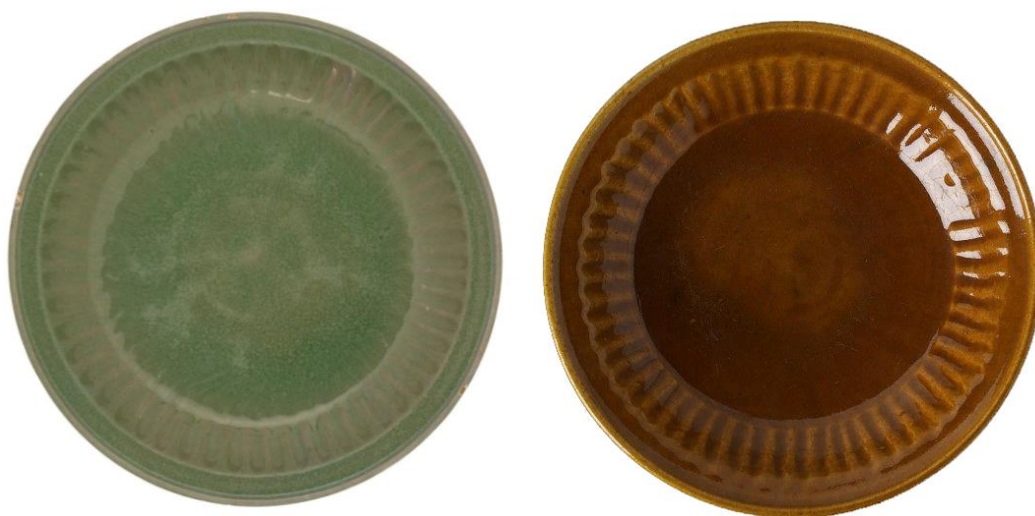
شکل ۷: دو نمونه از سفال‌های لعاب‌دار تک‌رنگ خمیره فریتی، سده ۱۰-۱۱ ه.ق، موزه ویکتوریا و آلبرت با شماره اثر 586-1889 و موزه فرییر با شماره اثر F1973.3

گروه دیگری از سفال‌های لعاب‌دار تک‌رنگ را نمونه‌های با نقش افزوده زیر لعاب تشکیل می‌دهند. این سفال‌ها از لحاظ تنوع فرم و رنگ لعاب تا حد زیادی مشابه گونه تک‌رنگ ساده هستند. اما در بخش‌های محدودی از این سفال‌ها نقوش افزوده دگمه‌ای شکل یا خال‌مانند با خمیره سفید فریتی، روی بدنه سفال اجرا شده است. این نقوش گاه شبیه به گل‌های پنج‌پر اجرا شده‌اند. این نقوش افزوده در بیشتر نمونه‌ها از ضخامت زیادی برخوردار نیستند اما در مواردی نیز کاملاً پهن و تا حدود قابل توجهی برجسته هستند. در کاتالوگ موزه‌ها، اغلب برای این شیوه تزئینی تاریخ سده ۱۱ ه.ق در نظر گرفته شده است؛ اما هیچ مرکز تولیدی برای این گونه سفالین معرفی نشده است (شکل ۸).