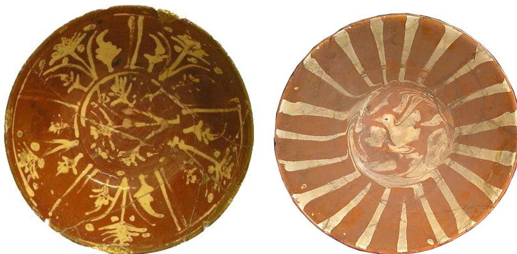
شکل ۵: نمونه‌هایی از سفال منقوش یا پاشیده نواری زیر لعاب قهوه‌ای، تولید نیشابور، سمت راست: سده ۱۰-۱۱ ه.ق، موزه متروپولیتن با شماره اثر 61.185.2 و سمت چپ: سده ۱۱-۱۲ ه.ق، موزه آشمولین با شماره اثر EA1978.2152

ب) سفال پاشیده یا منقوش کرم یا سفید زیر لعاب قهوه‌ای: این گونه سفالی خمیره‌ای رسی به‌رنگ نخودی مایل به قرمز با آمیزه ماسه‌بادی دارند و با تکنیک چرخ‌ساز ساخته شده‌اند. فرم این سفال‌ها اغلب دهانه‌باز و شامل اشکال مختلف کاسه، بشقاب و دیس است. در این شیوه تزئینی، که از رواج چندانی برخوردار نیستند، ابتدا نقوشی به رنگ کرم یا سفید به‌صورت منقوش یا پاشیده به‌صورت نواری یا ابر و بادی، روی بدنه سفال کشیده شده است. سپس کل بدنه سفال با یک لایه لعاب شفاف قهوه‌ای روشن یا تیره، آغشته شده است. با توجه به اطلاعات موجود در وب‌سایت برخی موزه‌ها، شیوه تزئینی لعاب پاشیده در بازه سده ۱۰-۱۱ ه.ق و شیوه منقوش زیر لعابی در بازه سده ۱۱-۱۲ ه.ق انجام شده و یکی از مراکز تولیدی آن شهر نیشابور بوده است (شکل ۵).