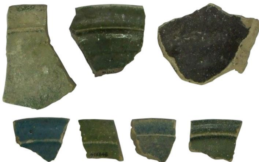
شکل ۴: نمونه‌هایی از سفال‌های لعاب‌دار تک‌رنگ لکه‌دار جنوب ایران، به‌دست آمده از بررسی ویلیامسون، سده ۸-۱۱ ه.ق ( Kennet & Priestman, 2005: 407، اصلاح شده توسط نگارنده)

ب) سفال پاشیده یا منقوش کرم یا سفید زیر لعاب قهوه‌ای: این گونه سفالی خمیره‌ای رسی به‌رنگ نخودی مایل به قرمز با آمیزه ماسه‌بادی دارند و با تکنیک چرخ‌ساز ساخته شده‌اند. فرم این سفال‌ها اغلب دهانه‌باز و شامل اشکال مختلف کاسه، بشقاب و دیس است. در این شیوه تزئینی، که از رواج چندانی برخوردار نیستند، ابتدا نقوشی به رنگ کرم یا سفید به‌صورت منقوش یا پاشیده به‌صورت نواری یا ابر و بادی، روی بدنه سفال کشیده شده است. سپس کل بدنه سفال با یک لایه لعاب شفاف قهوه‌ای روشن یا تیره، آغشته شده است. با توجه به اطلاعات موجود در وب‌سایت برخی موزه‌ها، شیوه تزئینی لعاب پاشیده در بازه سده ۱۰-۱۱ ه.ق و شیوه منقوش زیر لعابی در بازه سده ۱۱-۱۲ ه.ق انجام شده و یکی از مراکز تولیدی آن شهر نیشابور بوده است (شکل ۵).