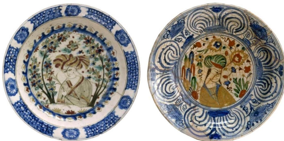
شکل ۱۹: دو نمونه سفال آبی و سفید-کوباچه، سده ۱۱ ق. احتمالاً تولید اصفهان، موزه هنر آسیایی با شماره اثر B60P1952 و موزه ویکتوریا و آلبرت با شماره اثر 919-1904

سفال آبی و سفید-کوباچه: این شیوه تزئینی ترکیبی از نقاشی زیر لعاب آبی و سفید تک‌رنگ و کوباچه رنگارنگ بوده که باعث پدید آمدن طرح زیبا و متفاوتی روی ظروف سفالین شده است. این شیوه تزئینی تنها در ظروف دهانه‌باز همچون دیس یا بشقاب اجرا شده است. این گونه سفالین اغلب در سده ۱۱ ق. تولید شده و شهر اصفهان، یکی از مراکز اصلی احتمالی تولید چنین ظروفی بوده است (شکل ۱۹).