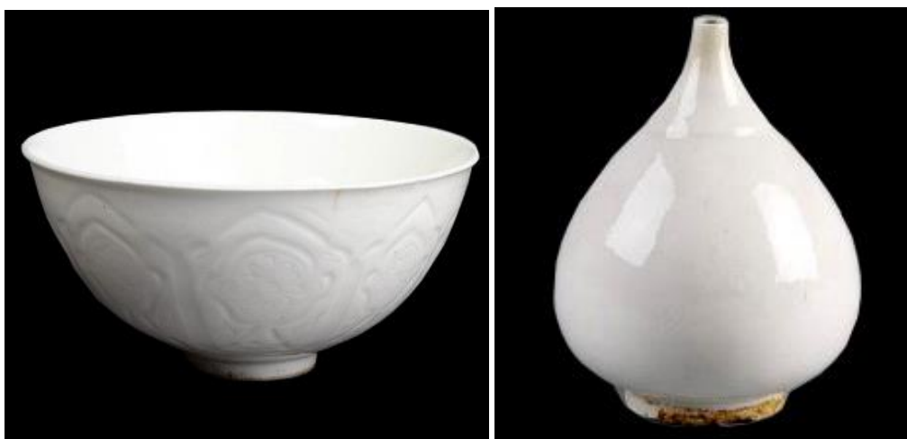
شکل ۱۰: دو نمونه از سفال لعاب‌دار تک‌رنگ ساده و تزئینی، نیمهٔ دوم سده ۱۱ و نیمهٔ اول سده ۱۲ه.ق، موزه ویکتوریا و آلبرت با شمارهٔ اثر 2594-1876 و 2599-1876