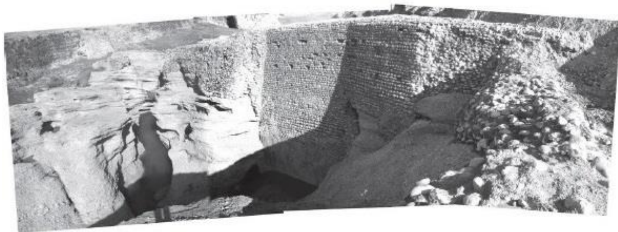
شکل ۱۳. سد جره در رامهرمز.

با توجه به بستر پایین چشمه نسبت به محوطه، مسئله دسترسی و تأمین آب شرب سکنه، از طریق حفر کانال حل شده است. پیگیری رد کانال شاهد گویایی است بر این موضوع که یکی از دلایل اصلی احداث بند و کانال پیوسته به آن، آبرسانی به استقرار ساسانی واقع در امتداد آن بوده است. هم‌چنین وجود آسیاب را باید در راستای رفع بخشی از نیازهای معیشتی و غذایی (آرد کردن غلات) ساکنان این استقرار قلمداد کرد. عبور کانال از میان زمین‌های کشاورزی و جریان آب به‌طرف آبگیر پایین‌دست، دامنه کارکردی آن را گسترش می‌دهد. با این حساب، مشروب ساختن زمین-های کشاورزی، هدف دیگر سازندگان کانال بوده است. سازه، ضمن آبیاری زمین‌های پیرامون، آب را به داخل آبگیر/استخر منتقل می‌کرده است. امروزه آثار مخزن از سطح دشت تقریباً پاک شده است. اما در تصاویر ماهواره‌ای، شواهد گویایی از یک سازه‌ی چهارگوش دیده می‌شود. ابعاد و حجم احتمالی مخزن نشان می‌دهد که توانایی نگهداری و ذخیره آب نسبتاً زیادی داشته است. با این فرض، سازه می‌توانست کشت گسترده‌تری را تحت پوشش قرار