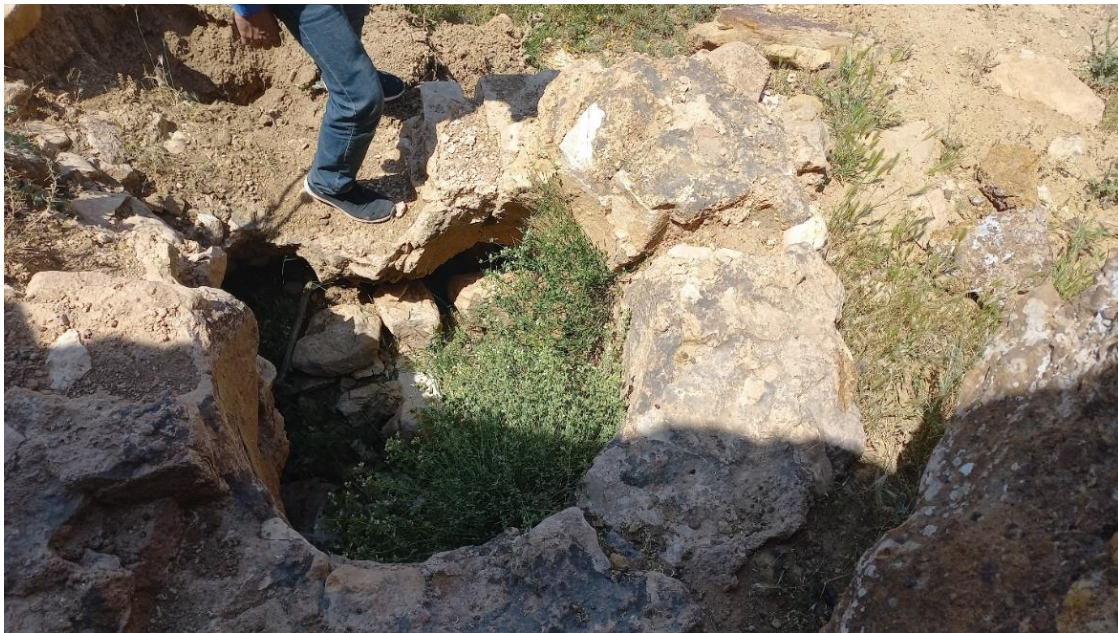
شکل ۱۰. بخشی از مجرای آب باقی مانده از آسیاب تنگ وراز.

آسیاب: در بستر تنگه و در فاصله ۶۰۰ متری جنوب سد بقایای یک آسیاب آبی دیده می‌شود (شکل ۹ و ۱۰). گذشت زمان و وقوع سیلاب‌های متعدد آسیب جدی بر پیکره‌ی آن وارد کرده است؛ به‌طوریکه تنها بخش‌های اندکی از تنوره و مجرای انتقال آب آن باقی مانده است. بخش‌های برجای مانده نشان می‌دهد که آسیاب با مصالح لاشه‌سنگ و ملاط ساروج ساخته شده است. قطر تنوره به ۱۰۰ سانتی‌متر می‌رسد که بیانگر بزرگی سازه است.