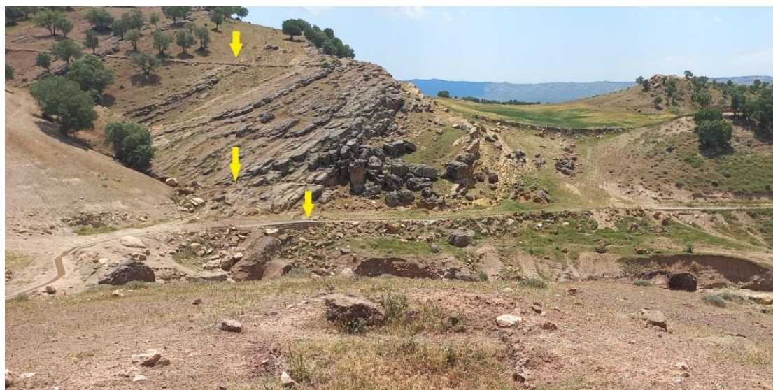
شکل ۷. بقایای کانال دوران معاصر و امروزی در ضلع شرقی دره.