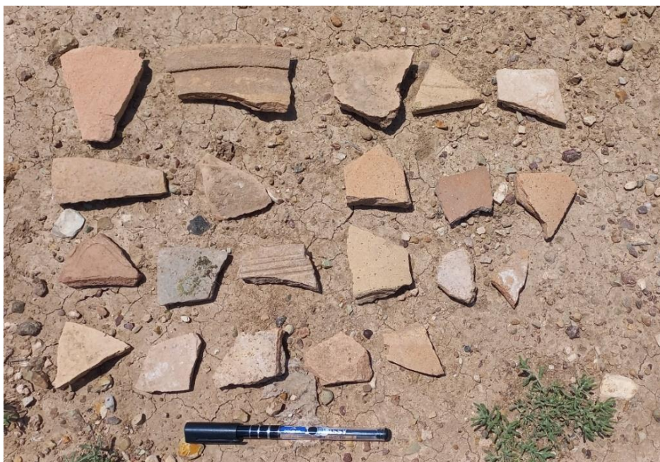
شکل ۱۲. نمونه‌های از سفال‌های پراکنده در سطح محوطه تنگ وارز.