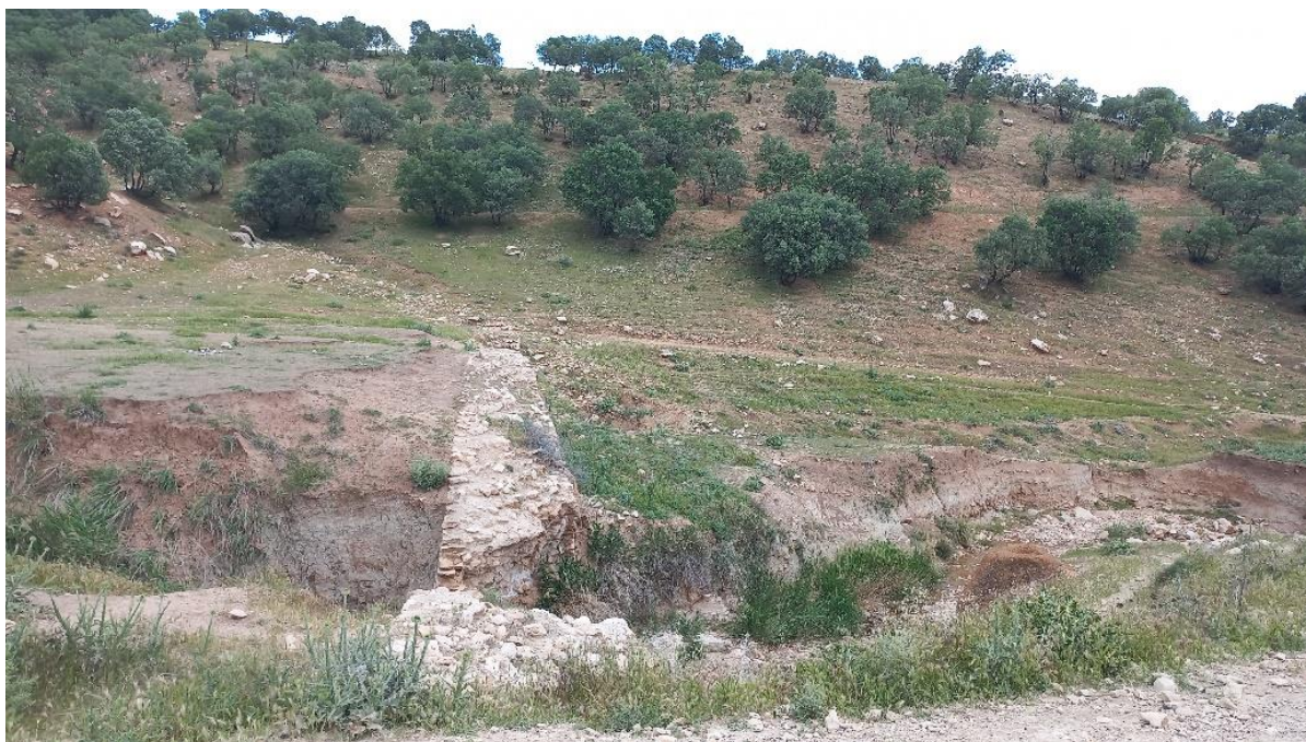
شکل ۳. سد تنگ وراز. دید از غرب.