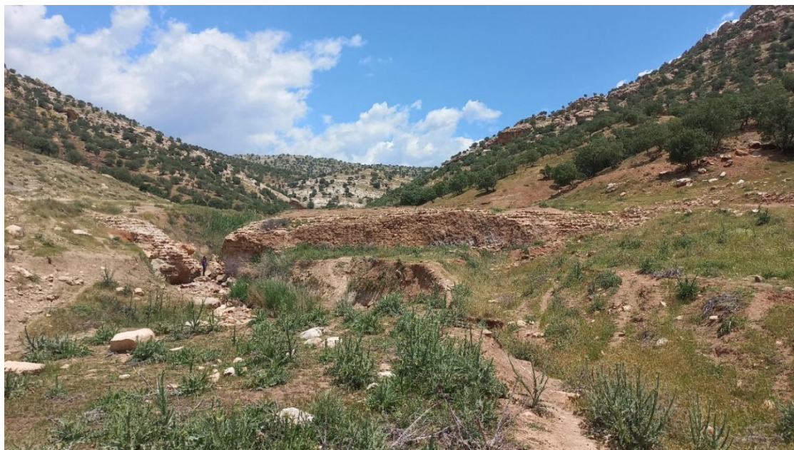
شکل ۲. دورنمای سد تنگ وراز. دید از جنوب.

مشخص شده است. در این قسمت آنچه که مشخص است اینکه دیواره سد روی صخره و بستر صخره‌ای سوار نشده است و آن را روی طبقات رسوبی کف رودخانه ساخته‌اند. دنباله‌های جانبی سد در ضلع شرقی و غربی نیز به صخره متصل نشده و در خاک رسی ایجاد شده است. مصالح ساخت سد سنگ (لاشه و قلوه) و ملاط ساروج است.