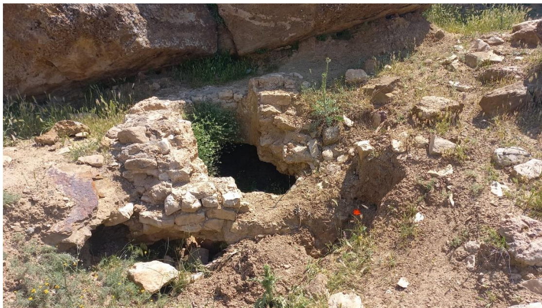
شکل ۹. بقایای آسیاب مخروطی در تنگ و راز.