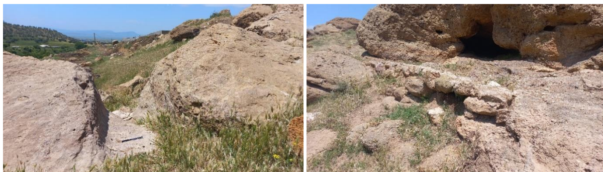
شکل ۶. بقایای کانال در ضلع غربی دره.