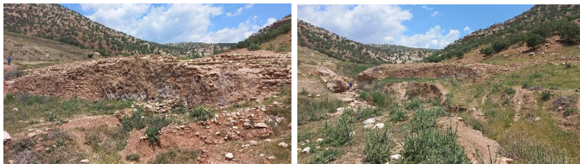
شکل ۴. سد تنگ وراز. محل شکسته شدن سد (سمت راست)، بقایای رسوبات روی دیواره بیرونی سد (سمت چپ).

کانال‌های انتقال آب: بر مبنای شواهد موجود و عکس‌های هوایی دهه ۵۰ شمسی در پایین دست بند/سد و به فاصله ۵۰۰ متری از آن شواهدی از کانال‌های انتقال آب مشاهده می‌شود. این کانال‌ها در دو طرف بستر چشمه و در اضلاع شرقی و غربی آن حفر شده‌اند (شکل ۵ تا ۷ و شکل ۱۱). آنگونه که از مدارک برمی‌آید کانال ضلع غربی بقایای کانال باستانی (احتمالاً هم‌زمان با ساخت بند/سد) محسوب می‌شود. سازه فوق بنا به بستر محیطی از مصالح مختلفی تشکیل شده است. در دامنه کوهپایه با برش بافت صخره‌ای و قراردادن سنگ/لاشه و ملاط ساروج ساخته شده و در میان بافت مسکونی و زمین‌های کشاورزی به شکل نهری خاکی نمایان می‌شود (شکل ۵ و ۶). پیمایش مسیر کانال و بررسی عکس‌های هوایی، چندین قطعه مجزا از آن به طول حدود ۱۵۰۰ متر را مشخص کرد. پهنای قسمت‌های قابل مشاهده سازه به حدود ۴۰ الی ۶۰ سانتی‌متر می‌رسد. کانال پس از عبور از دامنه کوهستان به روستای رشیدآباد می‌رسد و از بالای ضلع شمالی روستا با یک پیچ به سوی آگیری که در پایین دست آن و میان زمین‌های کشاورزی کنده شده، جریان می‌یابد. بخش‌های از کانال‌های ضلع شرقی در زمان پهلوی به وسیله خوانین غضنفری امرای منطقه (به گفته اهالی روستا)، جهت آبیاری باغی که در امتداد آن قرار دارد، ساخته شده و نمونه‌های دیگر در دهه‌های اخیر ساخته شده‌اند.