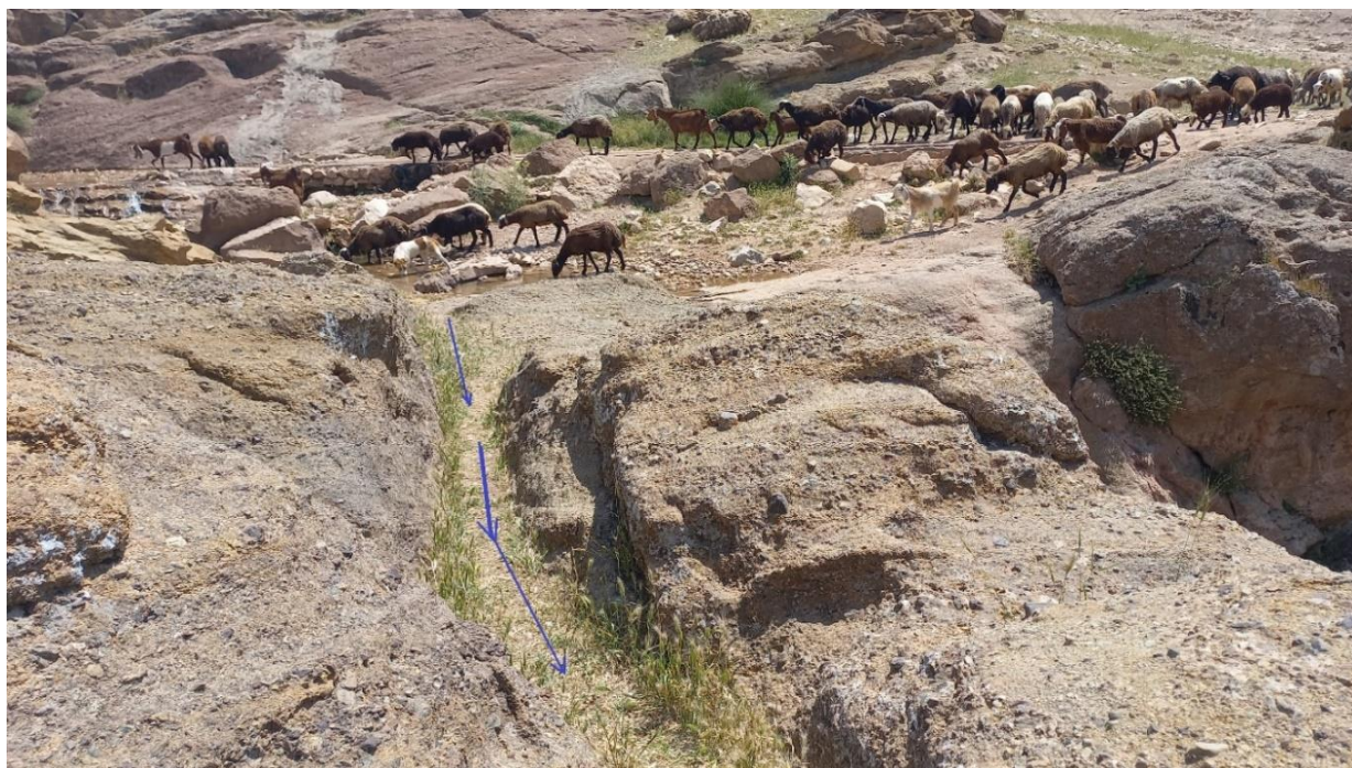
شکل ۵. بخش از کانال ضلع غربی دره وراز. برش صخره برای ایجاد کانال انتقال آب.