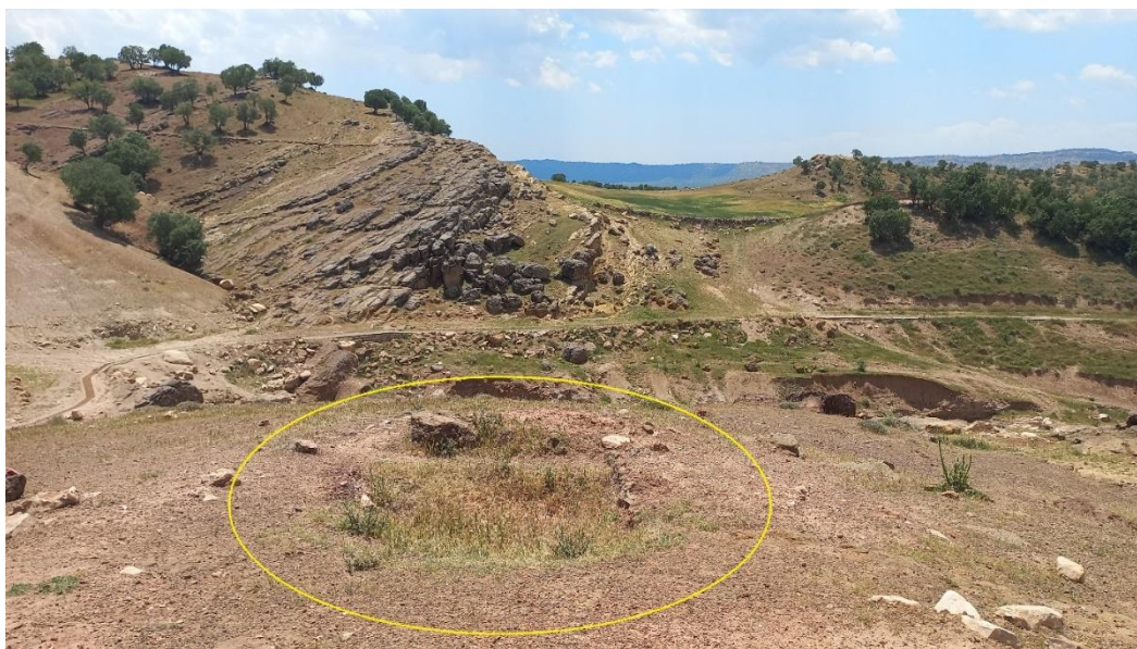
شکل ۸. بقایای حوضچه در ضلع غربی دره و راز.

حوضچه: در مسیر کانال ضلع غربی دره و در فاصله‌ی ۵۰۰ متری از سد بر روی یک پشته طبیعی که نسبت به دره و محوطه پایین دست در تراز بالاتری قرار دارد حوضچه‌ای در دل زمین کنده شده است (شکل ۸). سازه با حفر زمین و کارگذاشتن لاشه‌سنگ و ملاط ساروج شکل گرفته است. هم‌چنین آثار اندود بر دیواره‌های داخلی آن مشاهده می‌شود. طول و عرض حوضچه به حدود ۲ متر در ۱۵۰ سانتی‌متر می‌رسد، اما تخمین عمق آن به دلیل انباشت ضخیمی از رسوبات و خاک ناممکن است. چگونگی ارتباط این حوضچه با کانال و اینکه این حوضچه دقیقاً چه کاربری در مسیر این کانال داشته است، مشخص نیست.